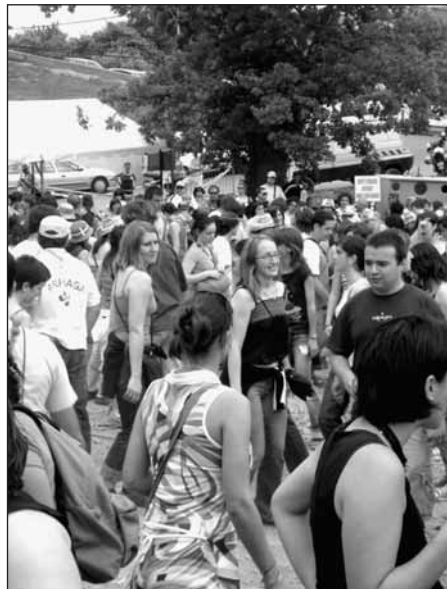
Affluence jeune à Herri Urrats

qui décideront si la langue doit avoir un avenir ou pas. Si la société en a la véritable volonté, la langue basque survivra, et alors, les responsables politiques d'ici reprendront le flambeau. Le gouvernement basque, de son côté, peut apporter son soutien et son aide dans la mesure de ce