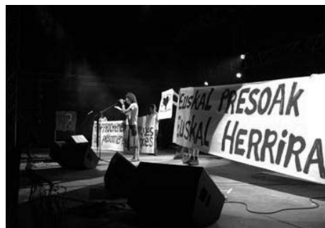
Rapprochement des prisonniers politiques basques