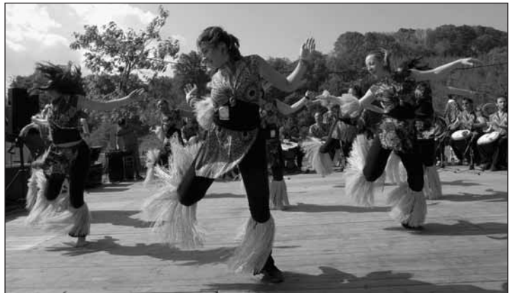
Parmi les animations, des danses africaines

C. B.: Pour moi Herri Urrats est un symbole à Senpere. Je n'en ai manqué aucun depuis le début. Je suis venue pour la première fois avec ma fille dans le kangourou. C'est dire l'importance que j'y attache. Cette année peut être encore plus parce que nous avons réalisé un centre de loisirs ikastola et que nous avons un partenariat avec Seaska qui nous versera une somme importante pendant au moins quinze ans. Je sais que c'est important pour la commune. Je sais qu'il y a de nouveaux projets. Il faut absolument que l'euskara continue et ce n'est pas à Senpere qu'il mourra.