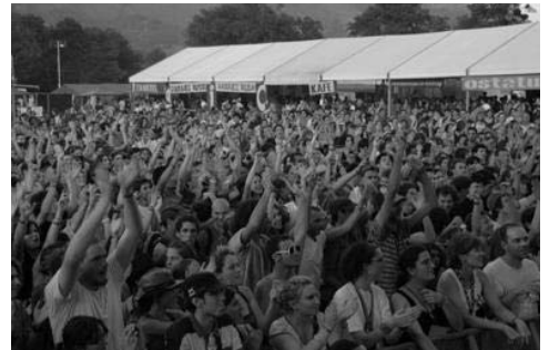
Eszenatoki nagusiaren aintzinean

Le changement de site du festival en 2004 et donc la venue à Idaux Mendy a permis de montrer la force d'Euskal Herria Zuzenean. Années après années, en seulement 3 éditions souletines on a pu sentir le renforcement d'un vrai amour du Festival de la part de la Soule.