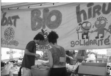
Ekologia, osagarria, elkartasuna, etab.

√ Une campagne d'information sur les OGM (via une conférence, des panneaux d'information sur le site, etc.).