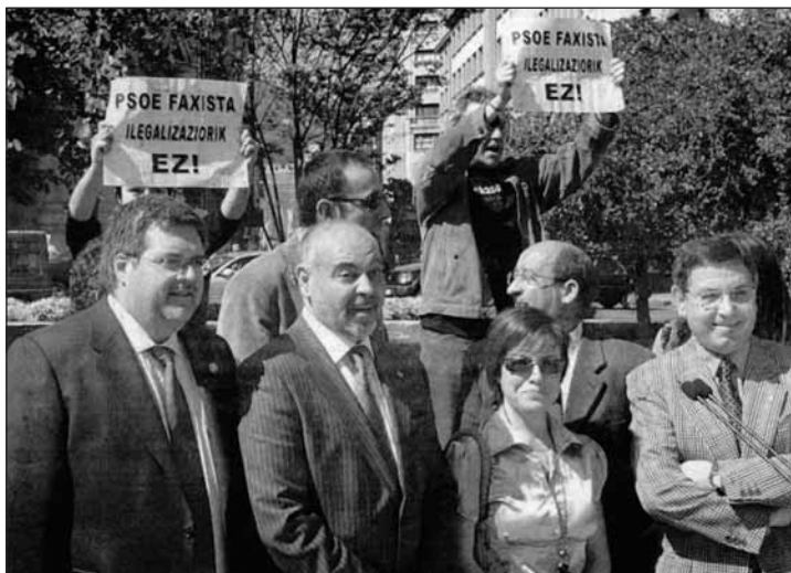
Quelques jeunes abertzale perturbent les candidats socialistes en campagne en Biscaye