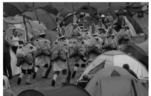
Joaldunak festibaleko akanpalekuan gaindi

Pendant les 3 jours du Festival EHZ, on met en avant des produits de qualité (locaux, bio, etc.). Euskal Herriko Laborantza Ganbara et l'association BLE nous ont aidés dans ce domaine. Des pratiques telles que le tri, mais aussi la participation (visite de stands d'exposition et débats ouverts aux festivaliers) sont aussi soutenues... →