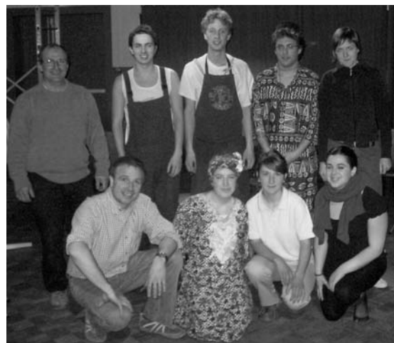
Kitzikazan/k amikuzeko antzerki talde gaztea

o Beste pasarte batzu argitaratuak izanen dira ondoko ale batzuetan.