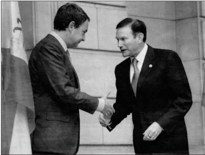
Rencontre à la Moncloa entre J. L. Zapatero et J. J. Ibarretxe

Une bataille politique majeure, complexe et passionnante s'ouvre en 2008. Aucun de ses chapitres n'est écrit d'avance.