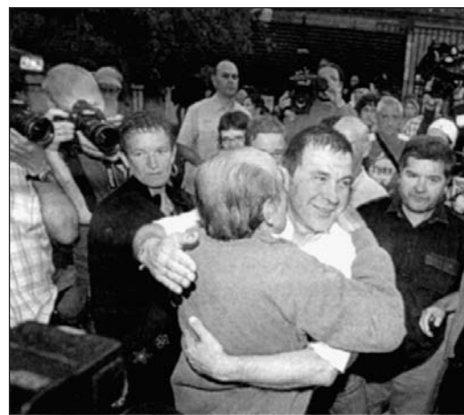
Chaleureux ongi etorri pour Arnaldo Otegi

C'est précisément vers les 743 prisonniers basques qui croupissent dans les geôles françaises et espagnoles et leurs familles que sont allées les toutes premières paroles d'Arnaldo Otegi: « En tout premier lieu, je voudrais embrasser chaleureusement tous mes amis que je laisse à l'intérieur des murs de Martutene et des autres prisons, ainsi