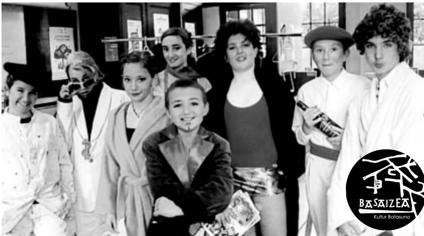
Joan den apirilaren 20an, So'in Baigorri gazte ikusgarriak, bideo, antzerki, musika eta kantuak nahasi ditu besteak beste... Gazteek, ikusgarriaren bidez eta ikusgarriaren preparatzeko, lurraldearentzat, euskararentzat eta tokiko ekimen eta aktoreentzat duten interesa aurkeztu dute... umorea lagun!

Baigorriko eskualdean, euskara eta tokiko bizia sustatzeko, Basaizea elkarteak, jendartearen parte hartzea bultzatzen du.