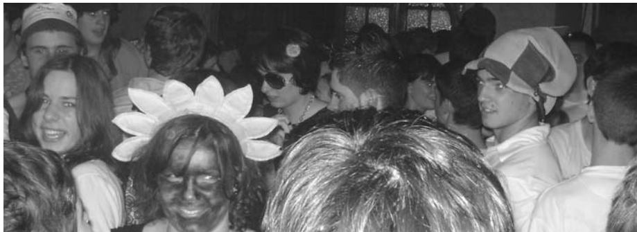
Bagatak antolatutako "Uda Gaua"!