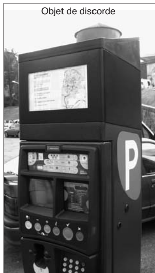
Objet de discorde

usagers de la voiture, si utile, si pratique et si appréciée des centaines de personnes, en particulier celles qui n'ont qu'une ou deux courses ou démarches à faire à Bayonne. Elle en a aussi profité pour réduire encore un peu plus les rares places «libres» dans certains parkings. C'est donc ce «coup bas» fait en période estivale qui m'a mis en colère.