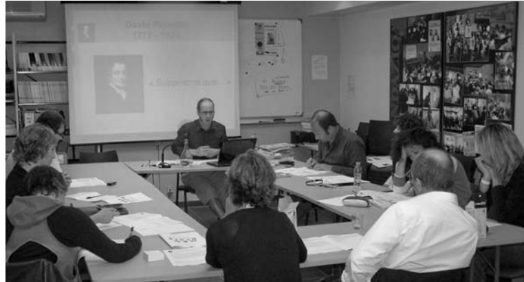
Journée de formation du samedi 7 juin 2008 "Un outil pour mieux comprendre les débats politiques et actuels"

Ce samedi 13 septembre, la formation "Keynes: suis-je un libéral?" nous permettra de mieux découvrir celui pour qui "Une histoire de l'opinion est un préliminaire nécessaire à l'émancipation de l'esprit. Je ne sais