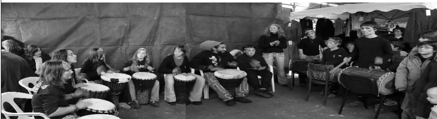
Aurten tailer jarraikia " So'in Baigorri " ikusgarriaren inguruan zen. 2009koa Afrikar eta Euskal perkusioen inguruan. Kantonamenduko 10 bat gazte jada hasiak dira trebatzen.