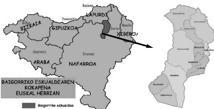
Kantonamenduan diren 11 herrietatik zonbeitzutan Basaizearen programa agertzen da aisaldien eskaintzan! Baigorriko eskualdean 5 500 biztanletik goiti badira.

Eredutzat erabiltzen ahal dugu So'in Baigorri ikusgarria, joan den apirilaren 20an arrakasta haundiarekin emana izan dena Baigorri. 11-15 urteko gazteek proiektua garatu eta oholtzan eman badute ere 6-10 urteko haurren parte hartzea izan da eszenatoki apailaketa tailerretan... bai eta ere Herri Urratseko jauntzien desfilean. Gazte ikusgarriak bideo, antzerki, musika, kantuak, etab. nahasi ditu besteak beste!