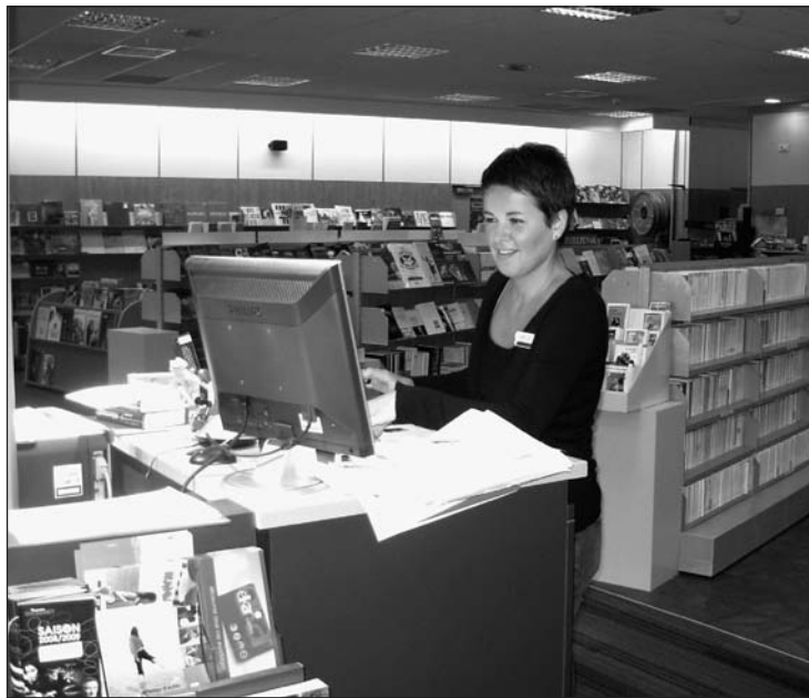
Elkar Megadenda, un espace souriant et fonctionnel

P. D'U.: Badu aspaldi etortze hori igurikatzen dugula! Espero dugu ikasle eta irakasle hauek gure auzoari ekarriko dutela, eta Baiona tipia kultur gune dinamikoa bilakatuko dela. Hiritar guzietan idekia izanen den kultur gunea,