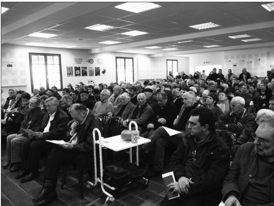
Durant l'assemblée générale à Ainhice-Mongelos

réaffirme « son soutien et sa volonté de l'accompagner dans cette démarche ». Danielle Mitterrand nous a également fait part de son intention de venir rencontrer les paysans qui animent l'association Euskal Herriko Laborantza Ganbara, dans les locaux d'Ainhice-Mongelos, au printemps prochain. La Fondation Danielle Mitterrand a été