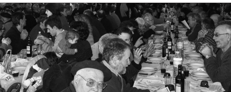
600 convives sous la tente