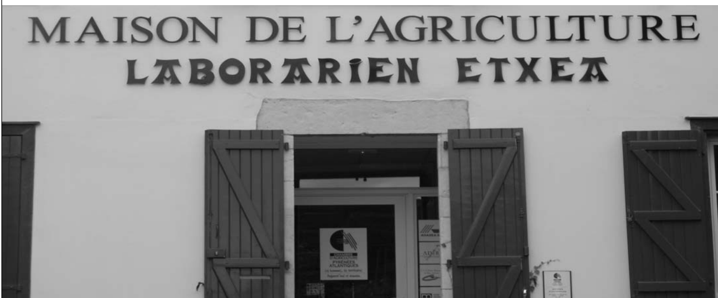
"Nous n'aurions pas non plus ce plaisir non dissimulé d'entendre les représentants de la Chambre de Pau et de la FNSEA clamer leur envie acharnée et leur droit à pouvoir utiliser la langue basque dans leur communication publique, à pouvoir s'appeler Laborantza Ganbara à tout bout de champ, eux qui avaient jusqu'à présent dénommé leur antenne d'Hasparren "Laborarien Etxea"."

Le gouvernement verrait ainsi s'arrêter cette dynamique stérile d'affrontement qui est entretenu depuis 4 ans autour de l'existence d'Euskal Herriko Laborantza Ganbara et qui crise inutilement la situation en Pays Basque. Il ne s'embourberait pas dans la situation inex- tricable que ne manquerait pas de créer une condamnation -même légère- d'Euskal Herriko Laborantza Ganbara, dont les animateurs et les