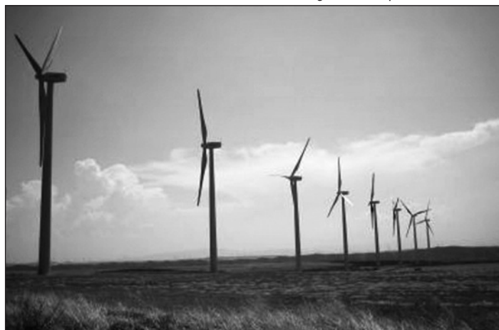
Un parc éolien en Navarre

tives pour une région avec de faibles ressources énergétiques».