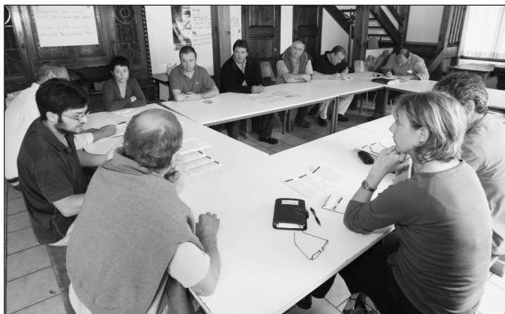
Un atelier de l'Université d'été AB de 2008

Bat-bateko itzulpena / Les interventions seront traduites en simultanée.