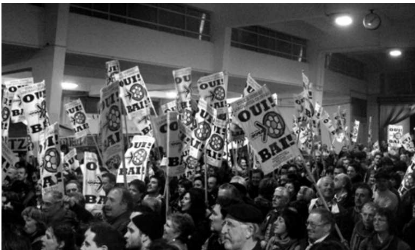
Mobilisation en faveur d'EHLG lors du procès en appel de Pau (18/2/2010)

Ce mercredi 12 mai, quand j'ai appris que l'Etat renonçait finalement à se pourvoir en cassation dans l'affaire Laborantz Ganbara, et que par conséquent la légalité d'EHLG était définitivement acquise, j'ai ressenti une joie plus intense que le jeudi précédant, en entendant le juge de la Cour d'Appel de Pau confirmer la décision de relaxe prononcée le 26 mars 2009 par le Tribunal de Bayonne.