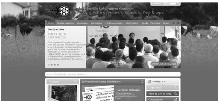
www.ehlgbai.org, site d'EHLG pour construire l'alternative nécessaire