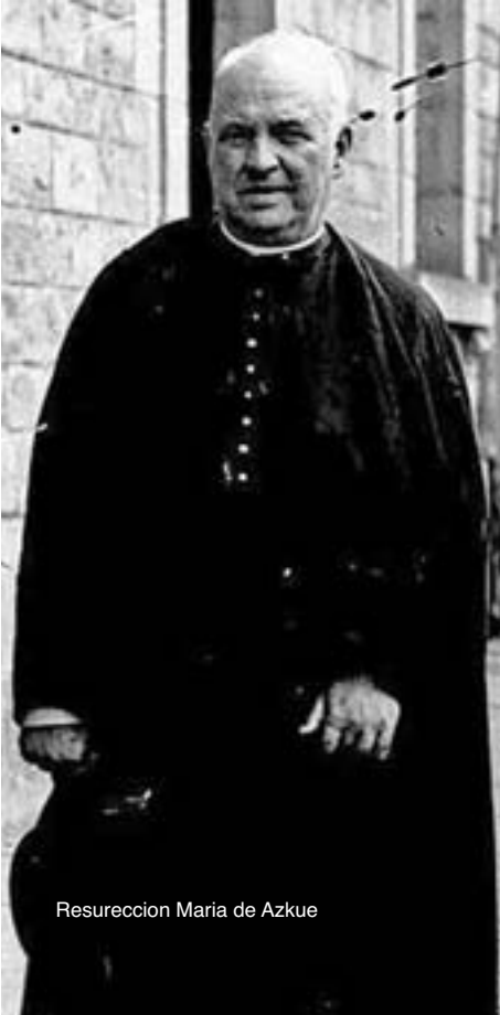
Resurreccion Maria de Azkue