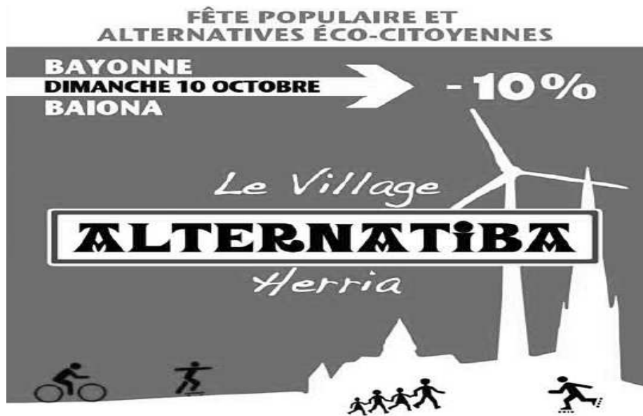
"Alternatiba, le village écologique, tracera un beau chemin vers le futur que l'on peut emprunter tous ensemble." (Susan George, marraine du Village Alternatiba)