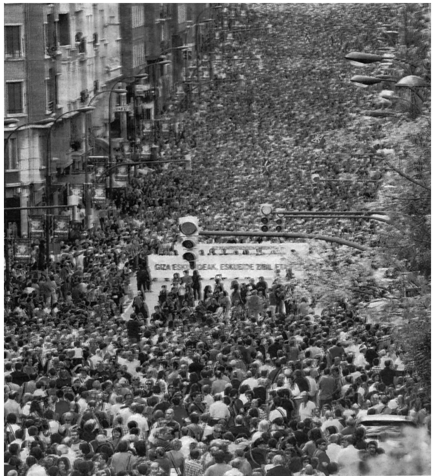
Foule énorme à Bilbao le 2 octobre à l'appel et avec la participation de toutes les organisations abertzale: PNV, Aralar, Batasuna, EA, AB... sur le thème "Défense des droits humains, civils et politiques de tous".

Mais il y a plus. L'élaboration d'un futur pôle souverainiste amène le PNV à radicaliser son discours pour une raison bien précise. Il ne veut pas se laisser cantonner dans la gestion de l'autonomie sans grande perspective et laisser le champ libre à une gauche abertzale