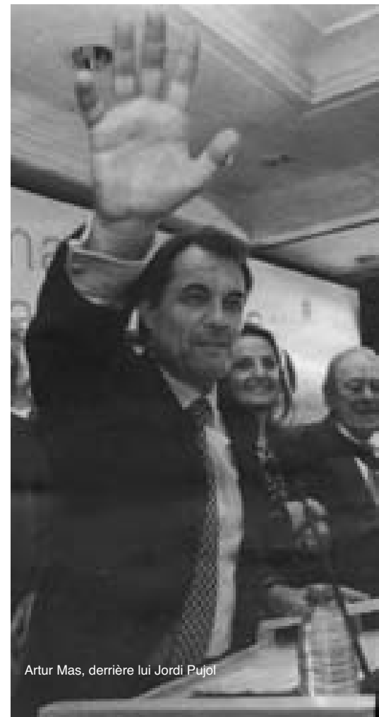
Artur Mas, derrière lui Jordi Pujol

Le PP devient le troisième parti de Catalogne avec 18 députés (+4) et 12,33% des voix, soit deux points de plus. Il s'agit d'un de ses meilleurs résultats depuis trente ans. Il croît tout particulièrement dans la ceinture de Barcelone, fief traditionnel du PSOE. Le Parti populaire caresse ainsi l'espoir de soutenir CiU au pouvoir et d'influer ainsi sur la vie politique d'un pays où il a beaucoup de mal à s'implanter réel-