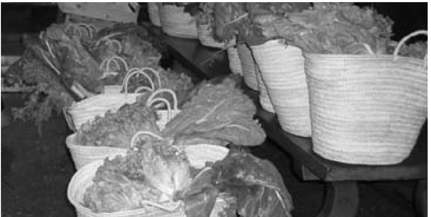
Barazkiak astero datoz, baserritarrak osatzen du saskia, eta janari berriak jaten ikasi dugu

“Postkarbono” etorkizuna preparatuz, tokian tokiko ekoizleak eta dendak harremanetan jarriz eta sasoiko elikagaien egutegia argitaratuz, besteak beste