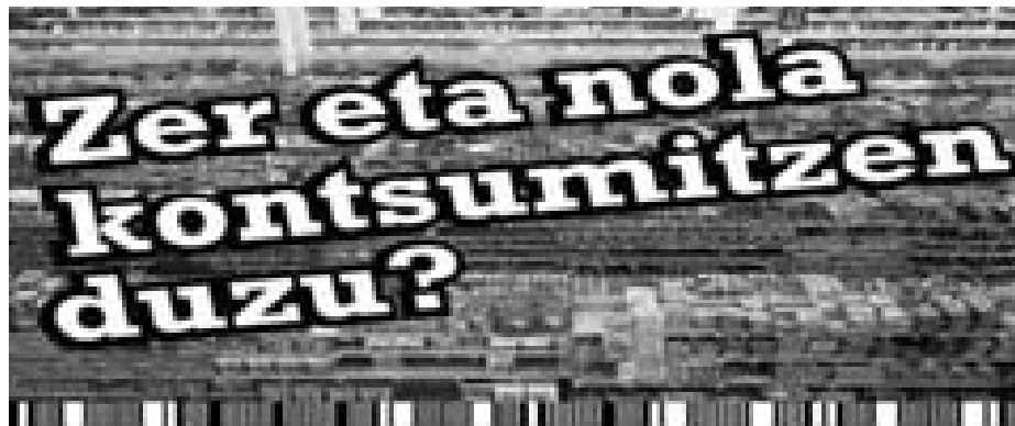
Kontsumo talde baten hitzaldirako gomitarren kartela