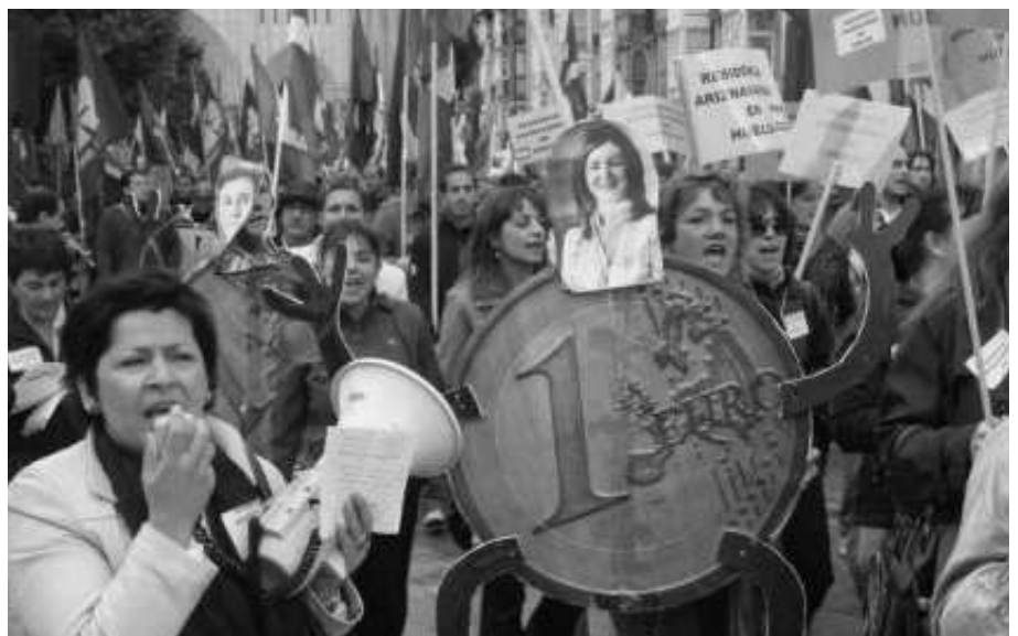
Grève et manifestation des salariées de la Maison de retraite Ariznavarra où ELA est majoritaire. Après 34 mois de grève (près de 3 ans !) les salariées ont eu gain de cause.