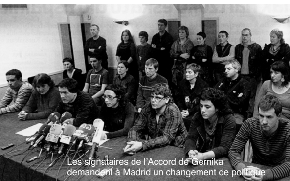
Les signataires de l'Accord de Gernika demandent à Madrid un changement de politique

La gauche abertzale de l'ex-Batasuna sait bien que sa légalisation n'est pas pour demain, du fait de la position d'ETA. Mais elle tente le coup. Elle n'a guère le choix et s'engouffre dans la brèche. Elle est prête à déposer de nouveaux statuts dont on examinera les textes à la loupe. Ira-t-elle jusqu'à condamner la lutte armée comme l'en adjure le procureur général de l'Etat au lendemain du communiqué du 10? Elle l'avait déjà fait discrètement lors de la présentation de sa liste aux élections européennes. Ses dirigeants