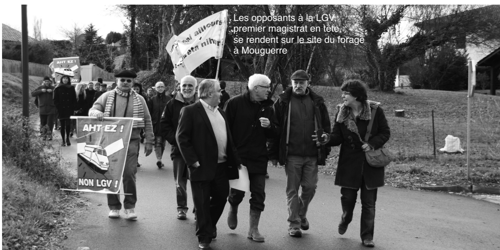
Les opposants à la LGV, premier magistrat en tête. Se rendent sur le site du forage à Mouguerre

Ce conflit illustre à merveille la quintessence de la politique sarkosienne qui ne croit qu'à la prédominance des intérêts financiers sur le bien-être des citoyens et au rapport de force brutal pour l'imposer.