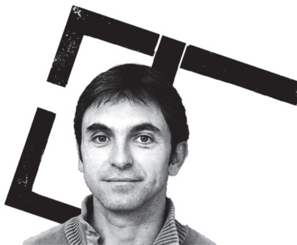
● Xabi Larralde

“ Le modèle de l'organisation post-franquiste reposant sur des statuts d'autonomie établis au nom du "cafe para todos" est aujourd'hui à bout de souffle et la crise économique actuelle l'a rendu encore plus obsolète.