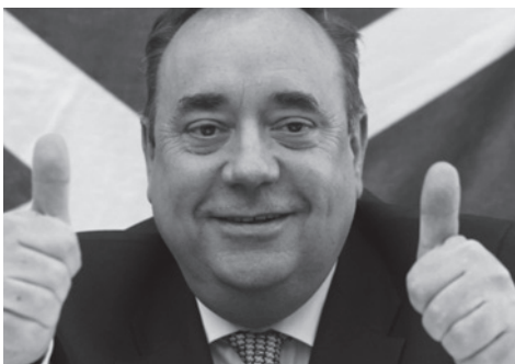
Alex Salmond, leader indépendantiste et chef du gouvernement écossais.

Quoiqu'il en soit, la tenue programmée à l'automne prochain des référendums en Ecosse et en Catalogne va marquer l'année 2014 du sceau d'un concept fondamental