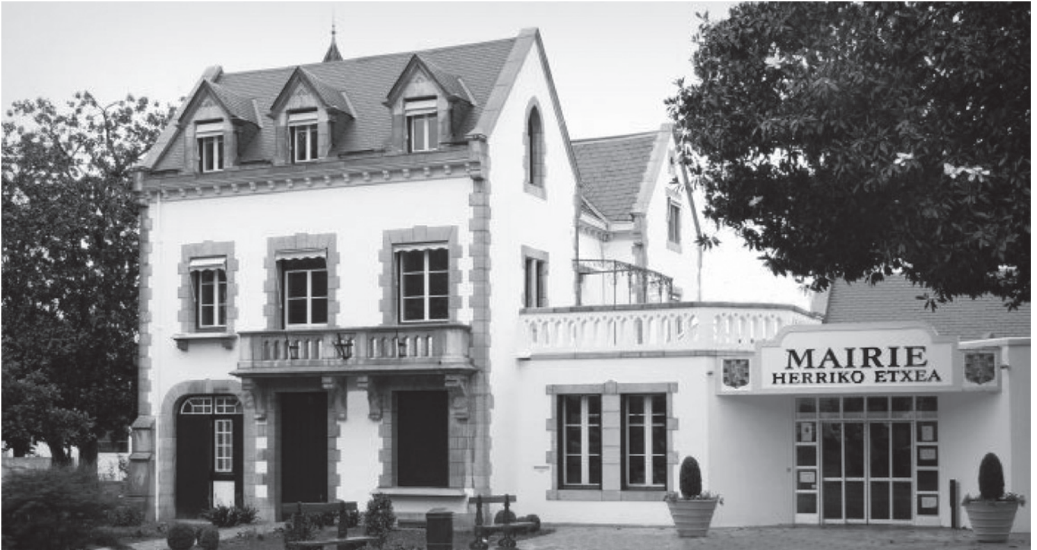
En 2008, Vincent Bru, maire de Kanbo, n'avait aucun adversaire.