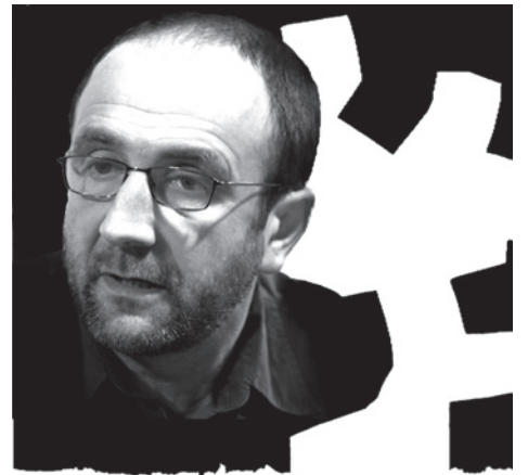
● Andde Sainte-Marie

“ Aditu ainitzen beldurra da, Espainia iraganean bezala, klandestinitaterat kondenatuko duela aborto lege berri horrek.