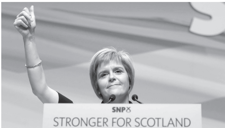
Nicola Sturgeon, présidente du SNP et premier ministre du gouvernement autonome d'Écosse.

A l'instar de celui de l'Allemagne, le système politique britannique se caractérise par sa clarté et sa simplicité. Le chef de file du parti majoritaire, ou, à défaut, celui du parti majoritaire d'une coalition, est automatiquement nommé premier ministre. Il ou elle est le détenteur du pouvoir politique central. On est loin du détestable modèle français