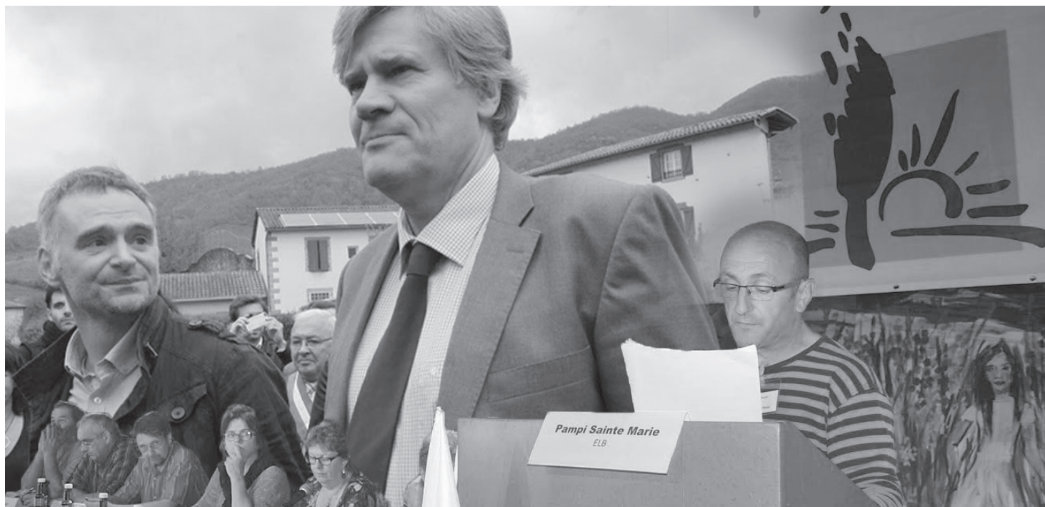
Stéphane Le Foll, Ministre de l'agriculture, de l'agroalimentaire et de la forêt, était au Pays Basque le 23 avril à l'occasion du Congrès national de la Confédération paysanne.

Eta ez ahantz : pour des fermes nombreuses dans des campagnes vivantes, pour des paysans reconnus aux savoir faire valorisés, pour une alimentation saine, savoureuse, accessible, pour un environnement préservé, Restons fermes! Défendons l'agriculture paysanne!