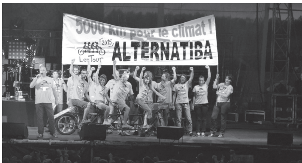
Symbole du tour Alternatiba, un tandem 4 places a été présenté aux 12 000 festivaliers d'Emmaüs Lescar-Pau, en juillet.

seront actualisés sur le site du Tour www.alternatiba.eu