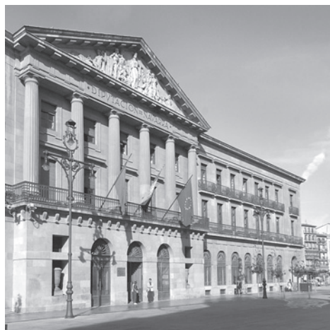
Le parlament foral de Navarre.

Opzio politiko berri hunen desafioa halere ez da batera errega, ez baita frentismo bati erantzun beharko bestelako frenteko politiko baten bitartez. Gauza ez litaikete ordezkatzeko frenteko