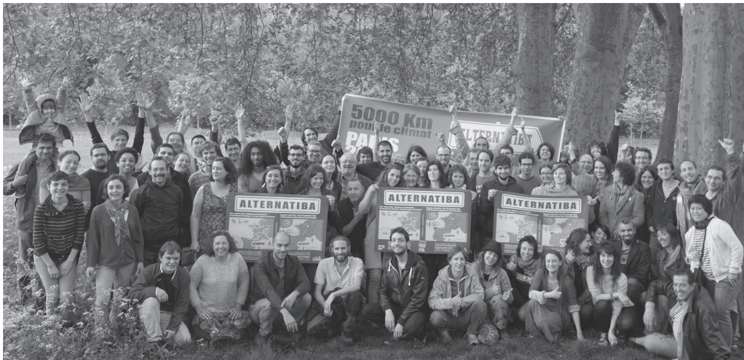
La 6 ème Coordination européenne des Alternatiba s'est tenue ces samedi 25 et dimanche 26 avril 2015 à Bègles en présence de 66 délégués de 30 Alternatiba.

Un an et demi après le lancement de la dynamique de mobilisation climatique des Alternatiba à Bayonne, celle-ci ne faiblit pas, bien au contraire. Plus de 70 Alternatiba — ces Villages des alternatives au changement climatique — ont eu lieu ou vont se tenir dans les mois qui viennent. A partir du 5 juin et pendant près de 4 mois, le Tour Alternatiba parcourra plus de 5000 kilomètres pendant l'été 2015 avec des vélos tandem 3 et 4 places, pour mobiliser des dizaines de milliers de personnes autour des vraies alternatives au changement climatique dans la perspective de la COP21.