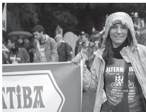
Alternatiba au Forum Social Mondial de Tunis.

P rès de 120 équipes locales, en comptant celles qui s'occupent d'organiser des étapes importantes du Tour Alternatiba, sont constituées sur 187 territoires différents et six Etats européens, regroupant chacune de quelques dizaines à quelques centaines de bénévoles. Un appel est d'ores et déjà lancé auprès de la population d'Iparralde pour qu'elle assiste nombreuse au départ du Tour, qui aura lieu le vendredi 5 juin, journée internationale de l'environnement, à 14h à Bayonne. Une fête populaire sera organisée à cette occasion à partir de midi au Carreau des Halles.