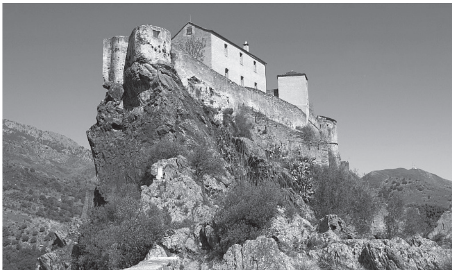
La citadelle de Corte, haut lieu de la souveraineté corse.

tique est au rendez-vous. Certes, le tableau n'est pas tout rose mais le chemin parcouru ces dernières décennies force le respect vu du Pays Basque où nous n'avons eu droit