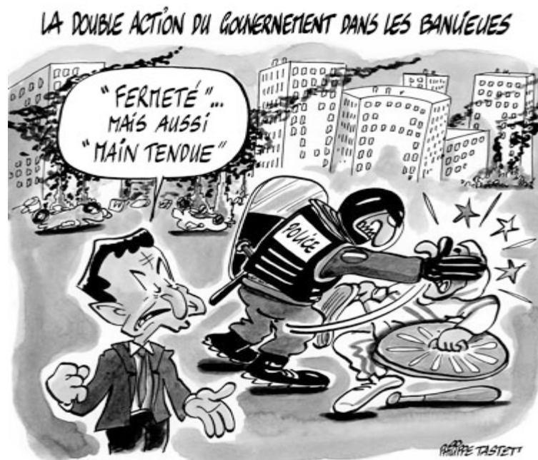
La doble acción del gobierno en las banlieues: «Firmeza»... pero también «mano tendida».

El modelo republicano consagra los encomiables abstractos de libertad, igualdad y fraternidad. Sin embargo, en tanto se enseñe a los ciudadanos de minorías de segunda y tercera generación que la única identidad cultural es la francesa, pero en los hechos no se les acepte como franceses y se les impida disfrutar de los derechos plenos de la ciudadanía francesa, el modelo francés alimentará la marginación en lugar de la integración democrática.