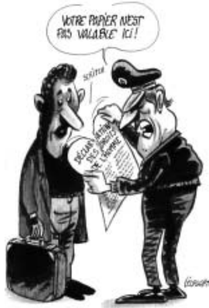
(Declaración de los Derechos Humanos) «Aquí sus papeles no valen».

muy concreta. Porque han vivido en espacios de negación. De negación de su futuro, de negación de su presente e incluso de negación de su pasado. De su futuro, porque se maleducaron en escuelas públicas que, por estar adscritas al lugar de residencia, concentraron en ellas a los niños de minorías, con menos posibilidad de apoyo de sus familias en sus estudios y con maestros desanimados ante la dificultad de la