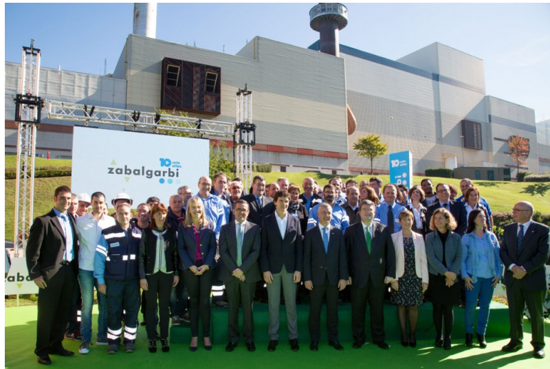
Bizkaiko Foru Aldundiko eta Eusko Jaurlaritzako ordezkari politikoak Zabalgarbin

ELA inongo Hondakinen Kudeaketa Planetan erraustegia oinarri izatearen aurka dago. Gure apustua beti izan da Zero Zabor helburua, eta helburu hau ahalik eta modu iraunkorrean errealitate bihurtzeko neurriak hartu eta beharrezkoak diren inbertsioak egitea.