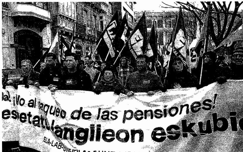
Miembros de ELA y LAB, durante la jornada de huelga general convocada el pasado enero.