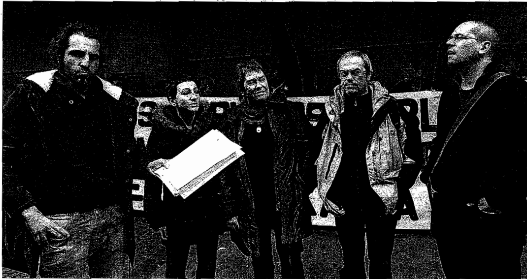
Los representantes sindicales posan con el preaviso de huelga en el sector público de Araba, Bizkaia y Gipuzkoa para el 9 de febrero.

Los responsables del sector público de ELA, LAB y STEE-EILAS presentaron ayer en la delegación del Gobierno de Lakua en Bilbo el preaviso de huelga para el 9 de febrero y llamaron a movilizarse para «responder a las graves agresiones de los gobiernos».