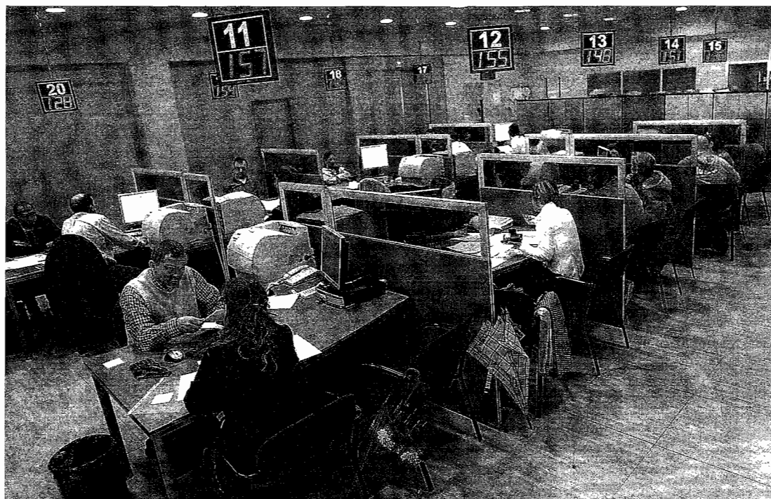
Contribuyentes navarros hacen su declaración en una oficina de la Hacienda foral, en Pamplona.

En Navarra, los tipos máximos eran hasta ahora de un 43% para las rentas anuales a partir de 88.000 euros y, como se señalaba, un 44% para las que estén por encima de 125.000. Los navarros que cotizan ingresos por encima de 88.000 euros son, según la úl-