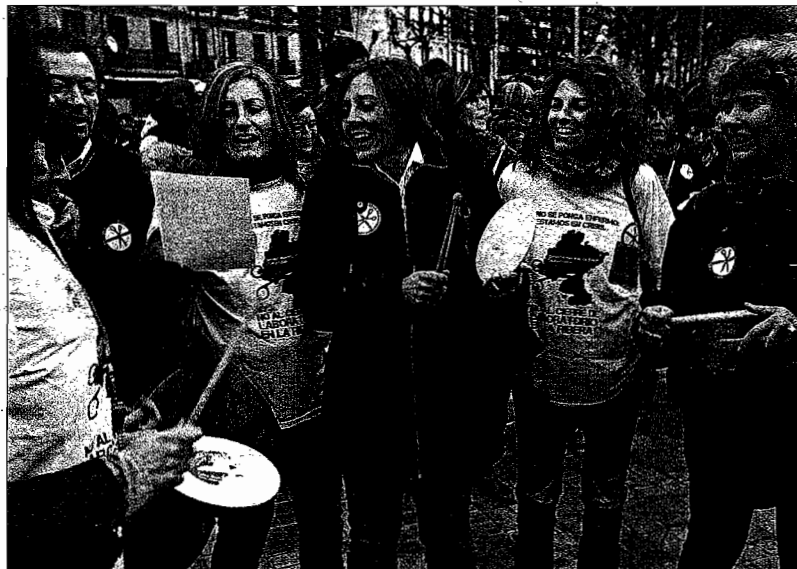
Trabajadores de Osasunbidea protestaron ayer ante el Parlamento de Nafarroa contra los recortes.

Ante estos datos, recalcaron que la centralización de los laboratorios de urgencias, que supone que «se van a llevar el 70%