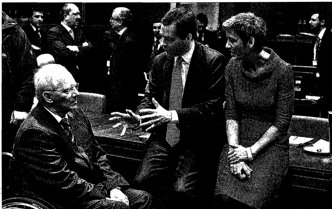
De izquierda a derecha, Wolfgang Schäuble, George Osborne y Margrethe Vestager, ayer en la reunión de Bruselas.