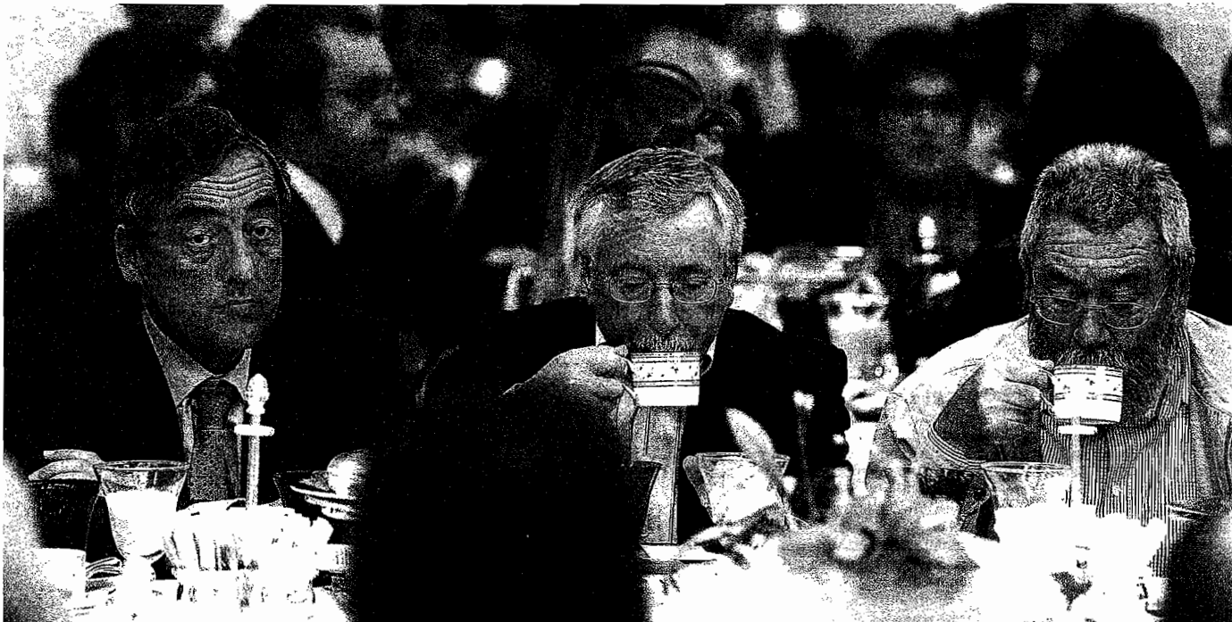
Capaces de acordar. El presidente de la patronal CEOE, Juan Rosell, y los secretarios generales de CC OO y UGT, Ignacio Fernández Toxo y Cándido Méndez.