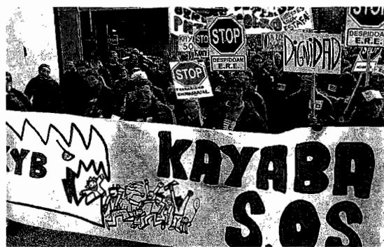
Protesta de la plantilla de Kayaba el pasado sábado.

El planteamiento sacado de la reunión de la mediación con el Gobier-