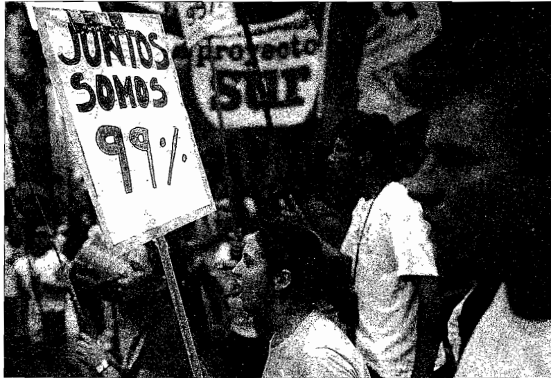
Una manifestación recorrió las calles de Porto Alegre coincidiendo con el inicio del Foro Social Mundial.

«Este foro no es una mera contestación a la arrogancia ne-