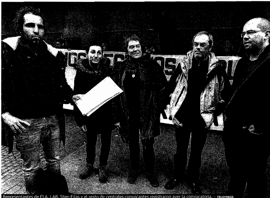
Representantes de ELA, LAB, Stee-Eilas y el resto de centrales convocantes registraron ayer la convocatoria.