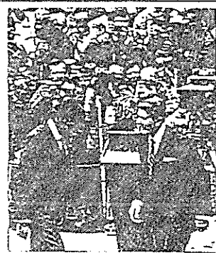
González entregó España a prestamistas, multinacionales, funcionarios de la CE y jefes de Estado

estatal se encamina a limitar la participación ciudadana, dominar las cadenas de comunicación y concentrar la actividad política en el liderazgo personal de la élite política. La "ciudadanía" se reduce a votar por un menú político de élite. Los votantes no son ciudadanos , en la medida en que no son miembros de una comunidad política. En España, la modernización a través de la liberalización de la economía se ha consumado en gran parte vía decreto ley, cosa que ha favorecido las