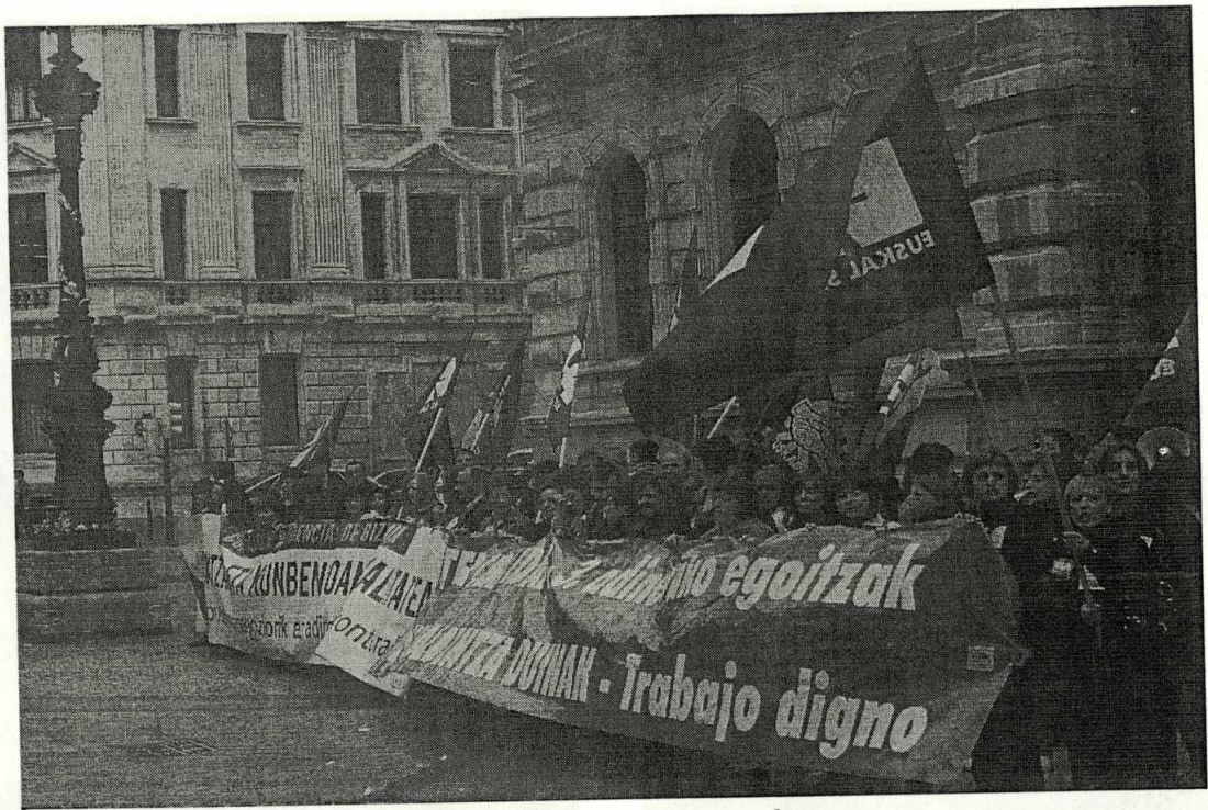
ANTE LA DIPUTACIÓN