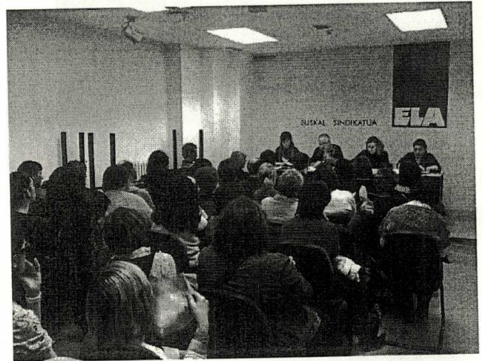
ASAMBLEAS DE DELEGADAS