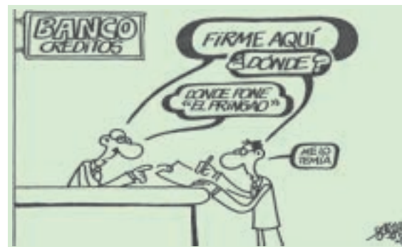
Forges, en El País

¡Estos si que saben de pensiones! Eso sí, al resto nos toca apretarnos el cinturón.