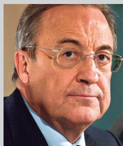
Florentino Pérez ACS Actividades de Construcción y Servicios

1.500 enplegu suntsituko ditu etekinak handitzeko. Jaurlaritzako Sailburu ohia.