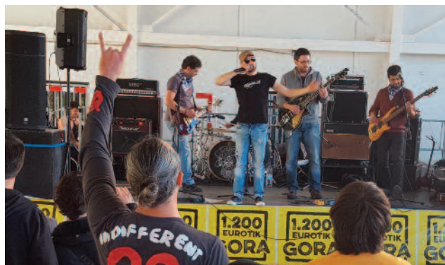
Muxutrock-ekin jauzika hasi ginen.