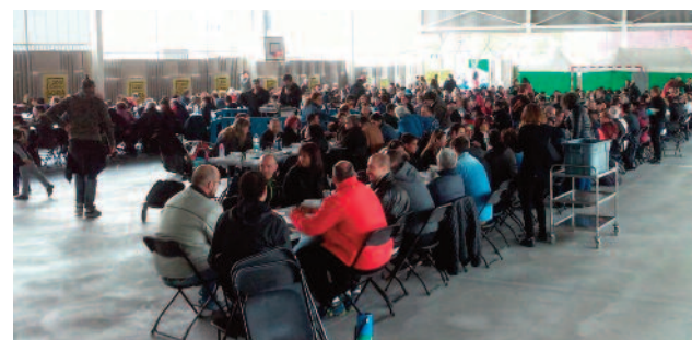
Bernart Etxepare ikastetxeak hartu zuen bazkaria.