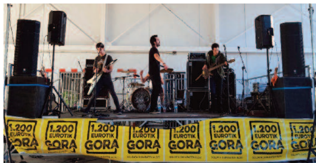
Nekez taldeak Txantreako jendea erakarri zuen.