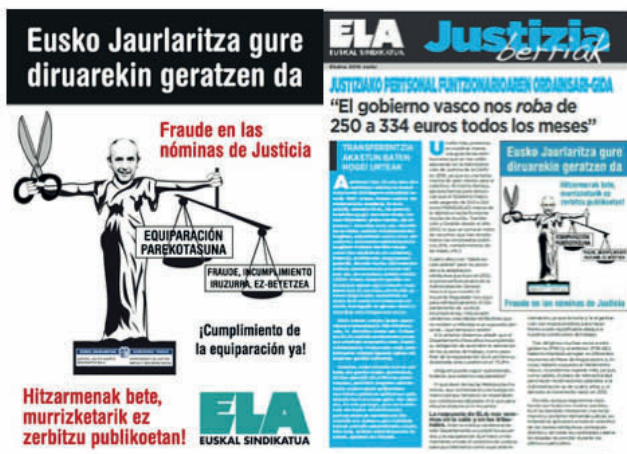
-Cartel y hoja informativa de la campaña de ELA en 2016-