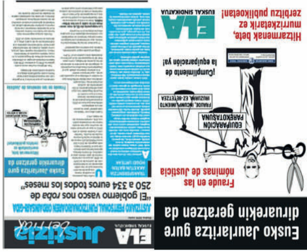
-Cartel y hoja informativa de la campaña de ELA en 2016-