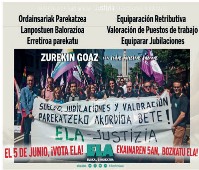
-Cartel elecciones sindicales 2019-

El año 2022 será el momento en el que las y los funcionarios de Justicia podamos por fin, después de 25 años desde la transferencia, tener nuestros puestos plenamente equiparados con las y los funcionarios/os de la Administración General de la Comunidad Autónoma de Euskadi. Para ello ELA lleva tiempo tendiendo puentes y trabajando a fin de que el Gobierno Vasco se avenga a negociar un acuerdo retributivo integral que evite la ejecución judicial de las sentencias y una nueva movilización del colectivo.