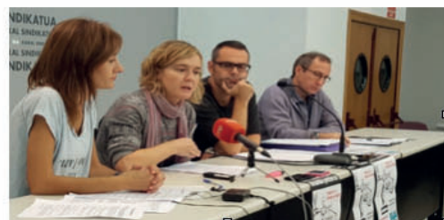
-Rueda de prensa de ELA para denunciar los incumplimientos-