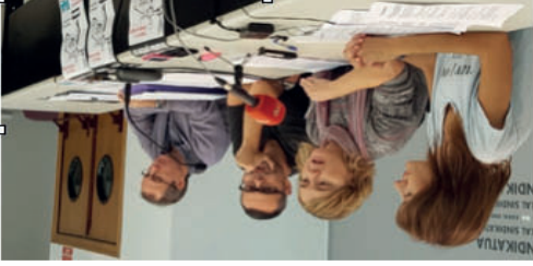
-Rueda de prensa de ELA para denunciar los incumplimientos-