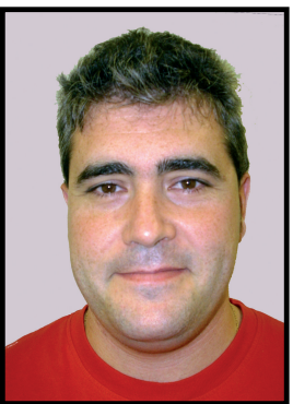
7. Iñaki Arregui Azpiroz Conductor