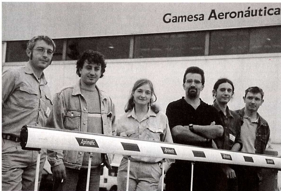
Miembros de la sección sindical de ELA en Gamesa.