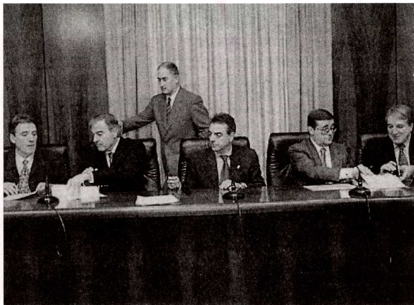
Foto de familia: Gobierno, sindicatos y patronal firman el "acuerdo por el empleo".

El nuevo régimen es más favorable y flexible. Por una parte, se pasa a poder llevarse a cabo con trabajadores/as a quienes falten cinco años para la edad ordinaria de jubilación, o sea, a partir de los 60 años generalmente, cuando hasta ahora la posibilidad era a partir de los 62. Por otra parte, la reducción de la jornada y correspondiente jubilación parcial se situaba hasta ahora en un porcentaje rígido del 50%, pudiéndose elegir ahora entre un mínimo del 30% y un máximo del 77%.