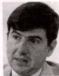
MANUEL PIMENTEL, ministro de Trabajo

Mientras el sindicato metalúrgico alemán, la IG Metall, ha alcanzado un acuerdo para posibilitar la jubilación a los 60 años, el ministro español de Trabajo y Seguridad Social, Manuel Pimentel, está pensando justo en lo contrario, es decir, en cómo impedir las jubilaciones anticipadas. El lo explica a lo fino cuando habla de que hay que debatir "cómo apurar al máximo los años de trabajo de las personas".