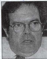
Alfredo Pastor, secretario de Estado de Economía

E l secretario de Estado de Economía se ha ganado a pulso el primer ladrillazo de nuestro boletín al declarar que una de las cosas que se pueden hacer para reducir el gasto social es retrasar la edad de jubilación. La cosa es muy sencilla: si los currelas se jubilan más tarde, cotizarán durante más años y les quedarán menos años de cobro de pensión. ¿Que cuánta? Ni corto ni perezoso, ha tirado de calculadora, y le ha salido que con un retraso de tres añitos de nada en la jubilación, el ahorro puede ser del orden de 400.000 millones de pesetas. Una pasta, vamos. Claro que, si en vez de tres se retrasa seis, el ahorro se duplica, si se retrasa nueve... ¡no se me embale, Sr. Secretario de Estado!