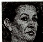
Margarita Mariscal de Gante, ministra de Justicia

Como si no bastara con ser ministra del ramo en los tiempos que corren, la ministra de Justicia, Margarita Mariscal de Gante, se ha empeñado en acreditar nuevos méritos para llevarse nuestro ladrillazo.