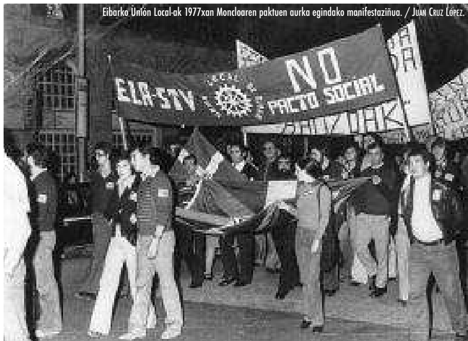
Eibarko Unión Local-ak 1977xan Moncloaren paktuen aurka egindako manifestaziñua.