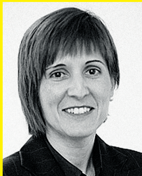
Elena Unzueta Bizkaiko Iraunkoratsuna eta Ingurune Naturala Zaintzeko foru diputatua