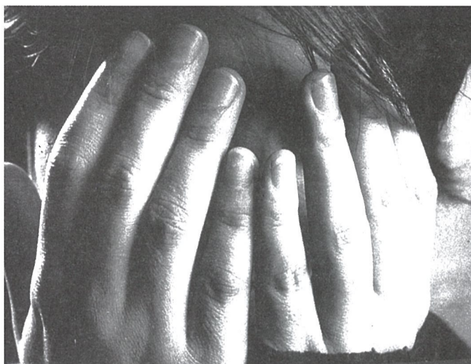
Bortizkeria gizartean ezagutu dadin lortu behar da.

■ Bizkaiko udaletxeen aurrean konzentrazioak egingo dira, eta instituzio publikoek eta Emakundek bertan izango dira beraien lazo zuriarekin: Horren aurrean, plante bat egingo dugu eta salatuko ditugu beraien jarrera paternalista eta negligentea emakumeen aurkako