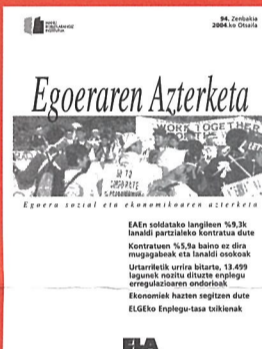
Manifestación conjunta de las plantillas de Caballito y Fundiciones Ocariz.