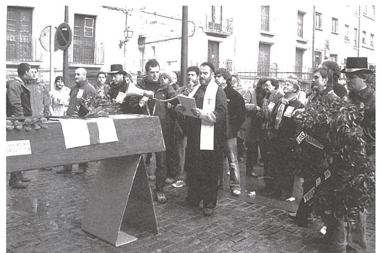
Los trabajadores/as del servicio de jardinería de Tudela han realizado originales movilizaciones, como el 'funeral' del servicio de parques y jardines.