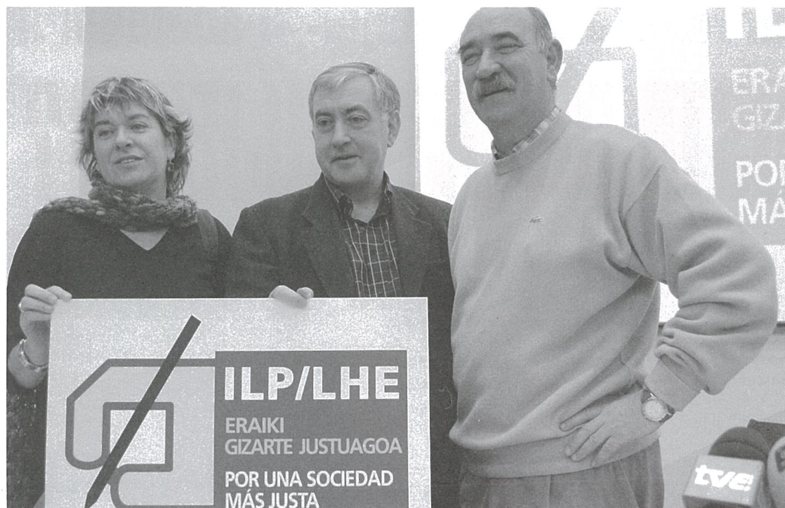
Lehen orrialdetik dator

ko errentaren gainean, eta bestea, menpekotasunaren gainean. Horrez gain, 5 mintegi antolatuko dira, hurrengo arlo hauek aztergai direla: etxebizitza, hezkuntza, osasuna, fiskalitatea eta immigrazioa. Eta dena, generoaren zehar-lerroetatik aztertuta.