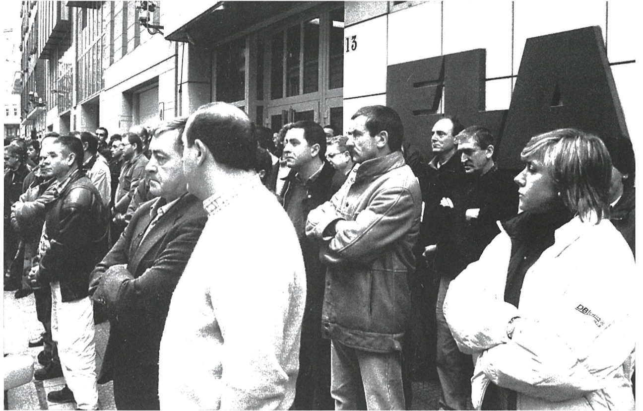
Concentración silenciosa realizada ante la sede de ELA en Bilbao el pasado viernes 23 de febrero.

Izan ere, greba-kutzarik ez duen sindikatua ez ote da sindikatu osoa izateko ezinbesteko osagaia-ri dagokionez motz geratzen?