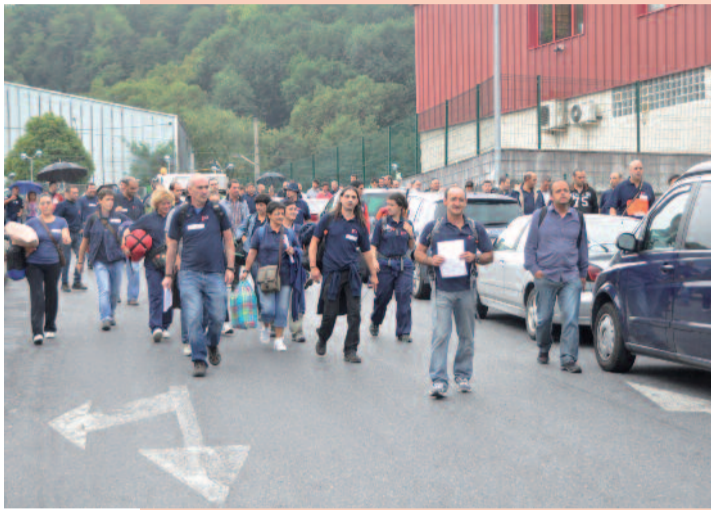
Parte de la plantilla de Formica entrando al encierro el miércoles 19 de septiembre.