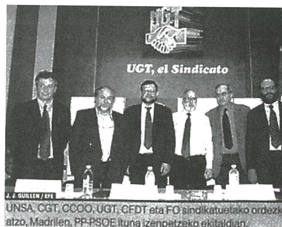
UNSA, CGT, CCOO, UGT, GFDT eta FO sindikatuetako ordezkariak, Madril, PP-PSOE ituna izenpetzeko ekitaldian.