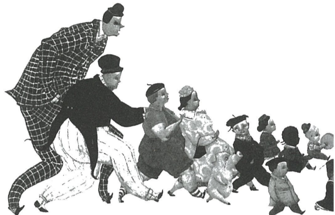
Ilustración de Carll Cneut sobre la desigual distribución de la riqueza.