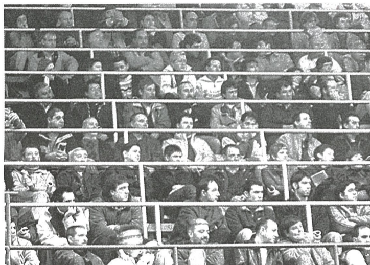
A la izquierda, imagen de algunos de los delegados/as asistentes.

movilización será positiva si en su gestión participan los trabajadores y trabajadoras de la empresa o sector y se analizan sus posibles consecuencias.