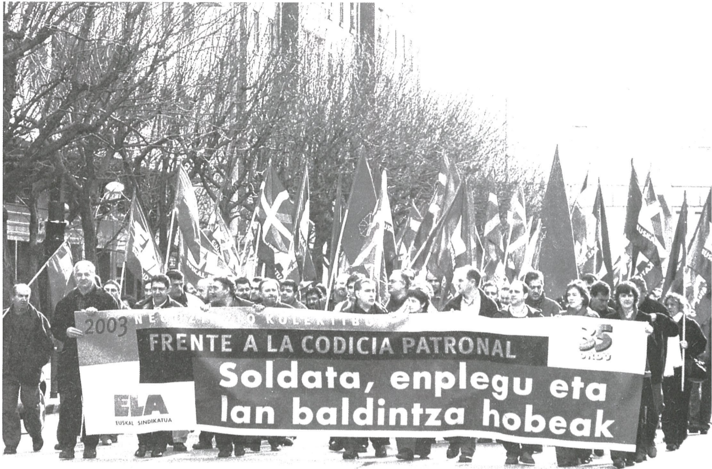
Ekitaldiaren ostean ELAko ordezkariak Donostiako kaleetan zehar manifestazioa egin zuten.

Beraz, negoziazio kolektiboan saihestu ezinako erabakia da zein ereduren arabera jokatu den. Baina komeni da gogoratzea aliantzek oinarrian siglak elkartze hutsa dutenean bide laburra egiten dutela, eta gutxien espero denean zapuzten direla.