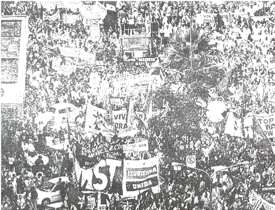
Osteguneko manifestazioan milaka lagunek hartu zuten parte.

Bestalde, Gizarte Foroaren bezperan ELA kide deneko hiru nazioarteko erakunde sindikalek, hots, Europako Sindikatuen Konfederazioak, Sindikatuen Munduko Konfederazioak eta Sindikatu Librean Nazioarteko Konfederazioak antolatutako foro sindikala ere bildu zen, eta 'mugimendu soziala gizarte zibilaren bihotzean' aztertzeko mintegia antolatu zuten.