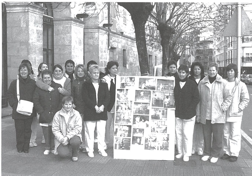
El conflicto de la residencia Uribarri es un ejemplo de subcontratación salvaje.

Vamos trasladar a cada institución, a cada ayuntamiento, a cada diputación, lo que ocurre. Haremos tantas asambleas como sean necesarias. Discutiremos de lo que le importa a cada persona que trabaja en este sector. A los que son fijos y a los que tienen contratos basura. A los que ganan más y a los que el sueldo no les alcanza para vivir.