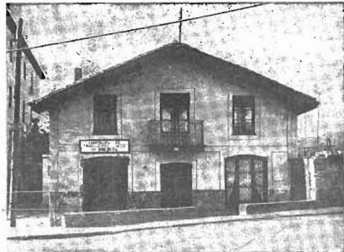
Exterior de la Cooperativa de Consumo de Trabajadores Vascos en Bolueta, inaugurada el día 29 de octubre de 1934

Permanente de los trabajadores emigrados y también reviste gran interés el estudio de la problemática relacionada con la juventud sindicalista. Otro punto del orden del día, en cuyo informe ha participado la representación de ELA-STV, será el que aborde todas las cuestiones relativas a la publicidad de la contabilidad y demás datos de la empresa.