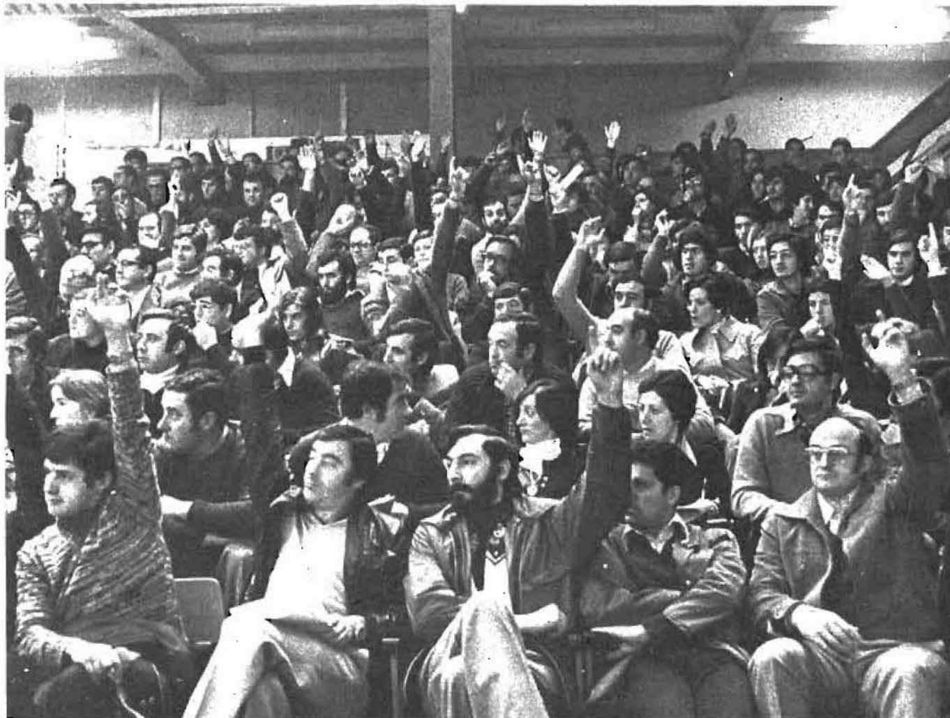
El tercer Congreso, celebrado el año pasado, abrió, en un ambiente de esperanzas e incertidumbres, un proceso de institucionalización para ELA-STV. A partir de esta fecha las etapas se han ido quemando con mucha rapidez. Las previsiones más optimistas se han ido cumpliendo y superando. Hoy, el segundo Consejo ordinario marca las cotas que se han alcanzado, el grado de organización adquirido. El horizonte para el sindicalismo vasco está mucho más despejado