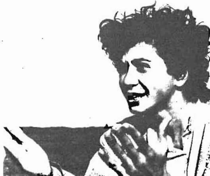
¿Cuántos jóvenes sin trabajo en el mundo? ¿Y en Euskadi? Hay que planificar la educación

Las estadísticas no reflejan, con todo, ni la gravedad de la situación, ya que muchos jóvenes parados no figuran en