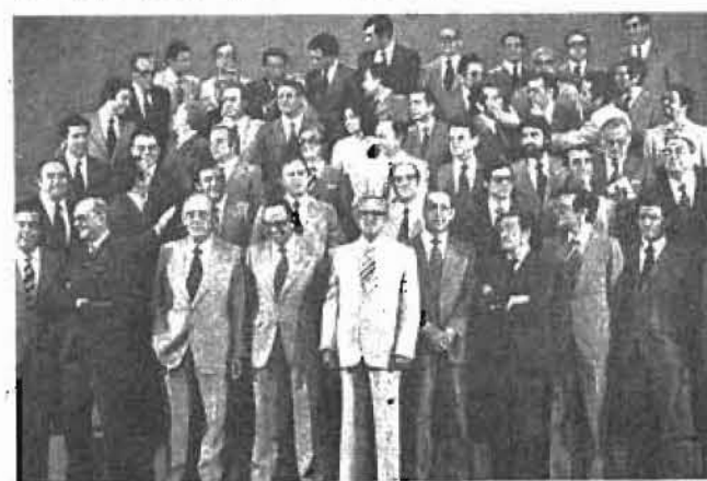
UCD quiere trabajadores que no huelan mal

El diario "Ya", de signo demócrata-cristiano de fuerte carácter conservador, está siendo una plataforma de promoción del sindicalismo denominado no-marxista y en concreto