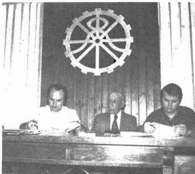
Unidos haciendo el sindicalismo vasco

—Completar las Federaciones Profesionales nacionales quedando la relación definitiva de éstas de la siguiente forma: Metal, Madera y Construc-