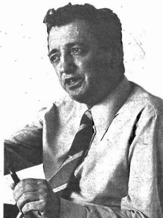
Edmond Maire, secretario general de la CFDT: "No vamos a avalar un programa de partido. Un sindicato debe crear la relación de fuerzas que haga posible la negociación".

"Ya he explicado más arriba nuestro método de confrontación pública. No se expresa por la búsqueda de un partido político en el que depositaremos nuestra confianza. ¡No!; la confianza nosotros la tenemos en nosotros mismos y en nuestra capacidad de hacer compartir nuestras proposiciones por la mayoría de los trabajadores".