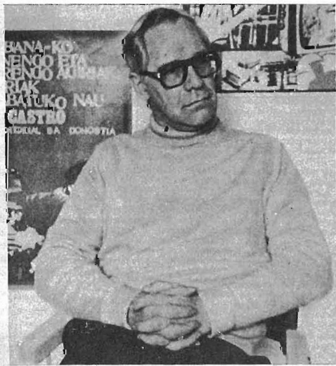
A. Gunder Frank, antiguo alumno de Chicago, hoy implacable crítico

—El movimiento Sindical europeo proseguirá una campaña de reducción en de horas trabajadas, de protección y aumento del poder de compra y de las mejoras sociales de los trabajadores.