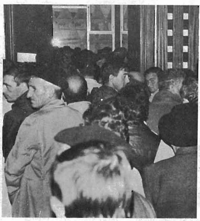
Arrantzale eta hondarrabitarrak juizioko salan sartu ezinik

izan. Hondarrabiarrek eskatzen zuten, kostatik itsasalderako sei eta hamabi millen artean hamuz arrantza egiten uztea eta, frantsesek eskaintzan ditzuten 30 lizentzien orde, hiruogei ematea.