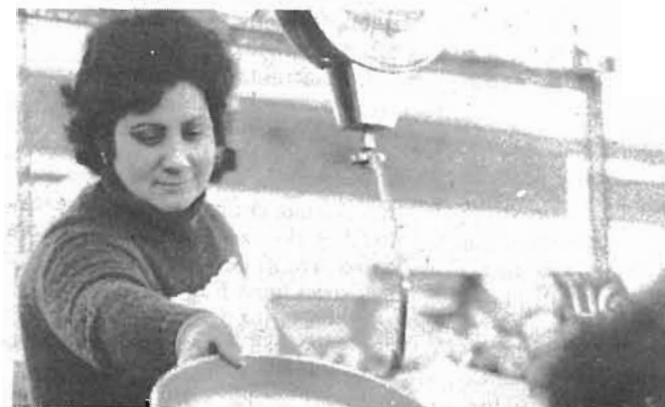
Erosketak, eguneroko abentura. Gaurko prezioak, atzoko jornalak