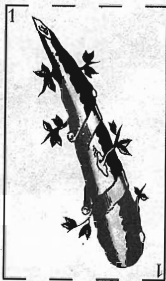
Instrumento para cazar Pa(c)tos