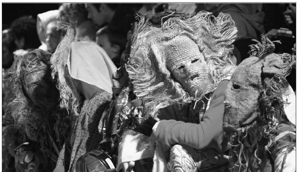
Le carnaval Hatzaro d'Ustaritz

✓ Samedi 18, 10h, SAINT-ETIENNE DE BAIGORRY (Plaza Xoko) Assemblée générale annuelle de l'Institut culturel basque.