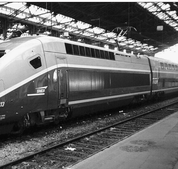
Le TGV en gare