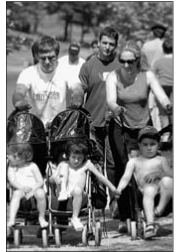
La fête en famille