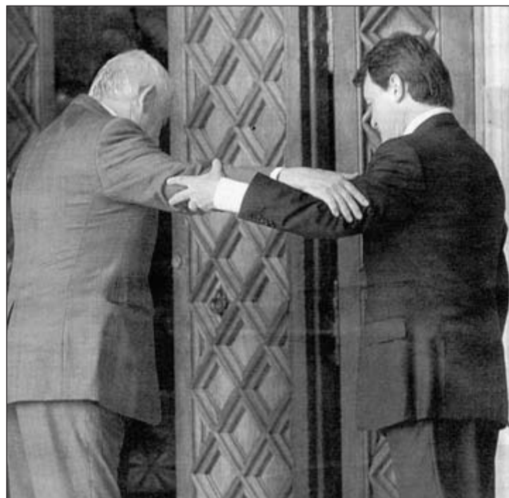
Le Président Maragall invite à entrer Artur Mas, leader de CiU

Les autonomistes de CiU qui appellent eux aussi à voter oui, offrent leur soutien parlementaire à l'exécutif so-