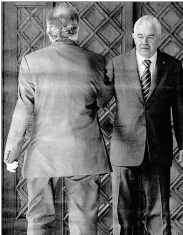
Le Président Maragall pousse à la sortie Lluís Carod-Rovira, leader de l'ERC