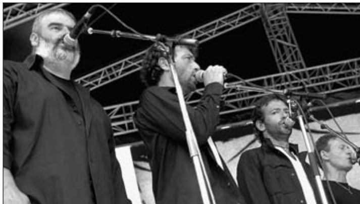
Les chanteurs corses de Canta u Populu Corsu

Plus d'une quinzaine de concerts sur quatre sites ont drainé des masses compactes d'auditeurs. Parmi eux les mythiques chanteurs corses de Canta u Populu Corsu.