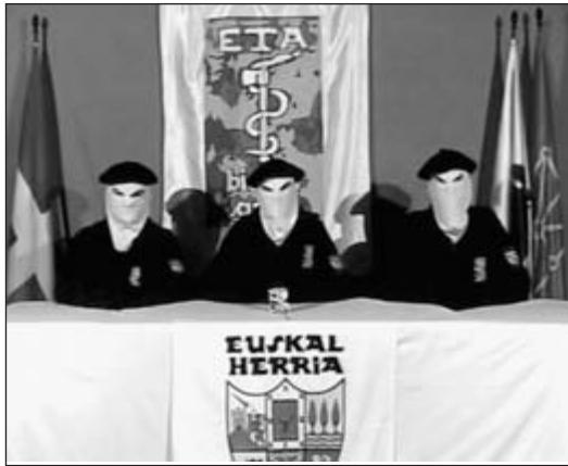
ETA face à la presse, pour son cessez-le-feu du 22 mars