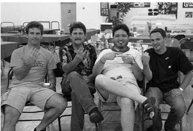
Boisen, diasporako topaketan ere...4 + 3 = 1

four incontournable pour développer de nouvelles idées pour favoriser l'exploitation de notre culture et notre langue. La plupart des euskal etxe assurent à présent des cours d'euskara, de danse, de gastronomie, on commence même à développer des Uda Leku (aux Etats-Unis) et le services des Txiki en Argentine..