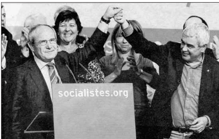
Passage de témoin dans le camp socialiste: José Montilla (à gauche) et Pasqual Maragall, Président sortant de la Généralitat

La ronde des négociations, des surenchères et des marchandages bat son plein. Le résultat sera suivi de très près en Pays Basque. Le 21 novembre, le nouveau parlement catalan se réunira, il élira le président de la Generalitat fin-novembre ou début-décembre.