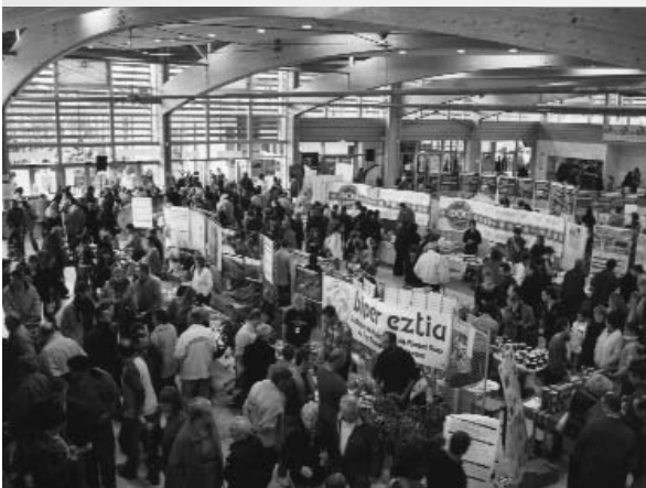
Lurrama 2007 - Merkatua

(2) et dans un premier temps au moins, à l'arrêt immédiat des inacceptables et innombrables pressions, menaces, sabotages qu'ils exercent à l'encontre de cette association démocratique et non violente par excellence qu'est Euskal Herriko Laborantza Ganbara.