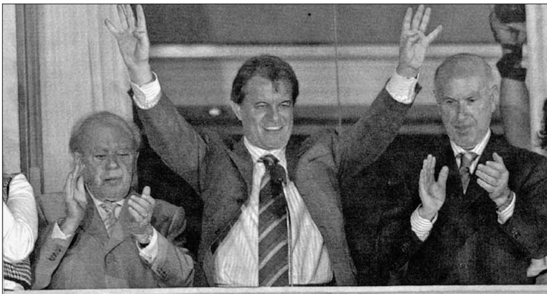
Artur Mas semble victorieux avec à ses côtés Jordi Pujol, l'ancien président de Catalogne

tilla, successeur de Pasqual Maragall, est dans tous les esprits. Situation paradoxale que la reconduction d'une alliance tripartite qui a échoué. Mais Artur Mas de CiU fera tout pour la faire capoter, y compris en proposant la «sociovergencia», l'alliance entre son parti Convergència i Unió et le Parti socialiste. Alliance «interne» ou «externe» avec participation ou non des socialistes à la Generali-