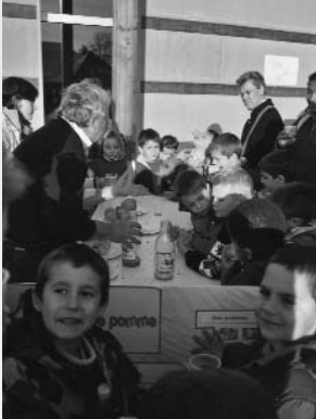
Lurrama 2007 - Haurren gunea

et son avenir, et entre autres d'une chambre d'agriculture. L'enjeu fort du combat de Laborantza Ganbara est que cette institution spécifique (1) fait un travail lui aussi spécifique. Et de la réussite de ce travail, ou au contraire de celui de la Chambre de Pau, découleront deux Pays Basque différents, deux types de relations différentes entre le monde paysan et le reste de la population, des qualités différen-