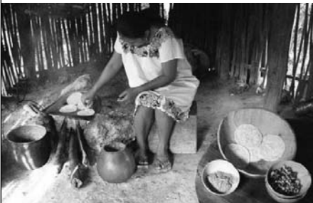
Projet Corredor Ecoturístico 8 Venado, comunidad de Santa Ana, état de Oaxaca au Mexique