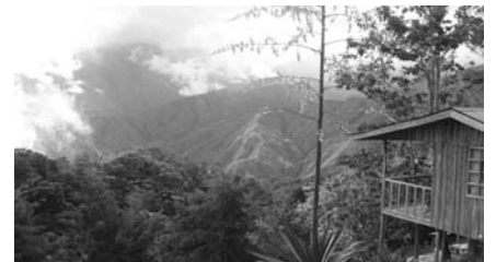
Costa Rica, chez les Durika : projet de cabane écologique (avec panneaux solaires) permettant l'entretien d'une réserve naturelle...

Avant tout militante, EchoWay s'attache également à dénoncer des lieux touristiques aux