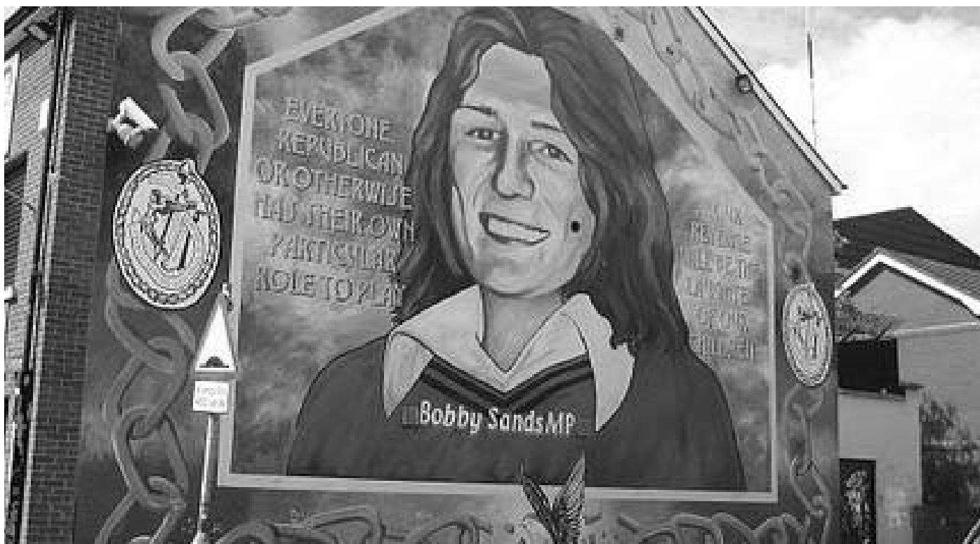
Robert Gerard Sands, komunzki Bobby Sands deitua (1954-1981), irlandar errepublikanoa, IRAko kidea, gose grebaren ondorioz hila Ipar Irlandako Maze kartzelan.

Le 5 mai 1981, Bobby Sands, membre de l'Irish Republican Army (IRA) emprisonné dans la prison du Maze près de Belfast, meurt après une grève de la faim qui a duré 66 jours. L'annonce de son décès provoque des scènes de violence en Irlande du Nord. Plus de 100 000 personnes assistent à son enterrement. C'est à Steve McQueen, jeune cinéaste britannique, que l'on doit la mise en scène de cet épisode crucial de la lutte indépendantiste irlandaise. Hunger (Faim) a reçu la Caméra d'or, consacrée à un premier film en lice dans toute les sélections lors du festival de Cannes 2008.