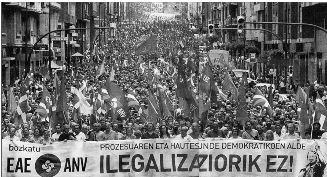
Manifestation contre l'illégalisation d'ANV à Bilbo en mai 2007

Mais l'euphorie est ailleurs. Le tirage de Noël de la «Lotería nacional» espagnole a fait de nombreux heureux en Hegoalde. Le champagne coule à flots. Comme disait le poète latin Juvénal, il y a près de 2000 ans: au forum, ils demandent d'abord «Panem et circenses», du pain et des jeux!