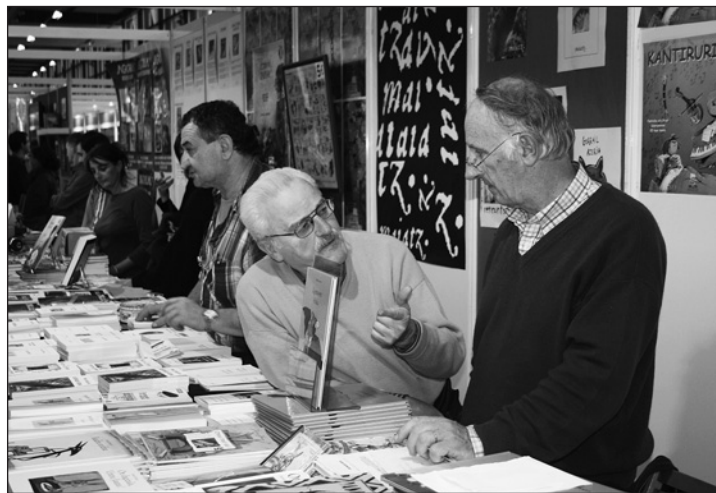
Les stands Hatsa, Eskualzaleen Biltzarra, Ikas, Maiatz et Gatzuzain

izanik ere. Etxeko gauzetaz mintzatzekotan, Agorila hor zen hamargarren aldikotz,