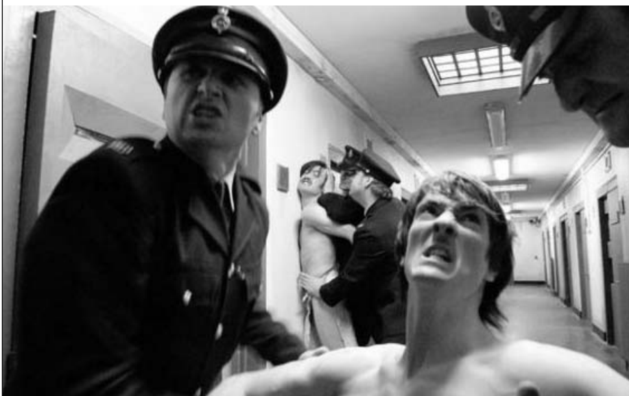
Une scène du film britannique de Steve McQueen, "Hunger"