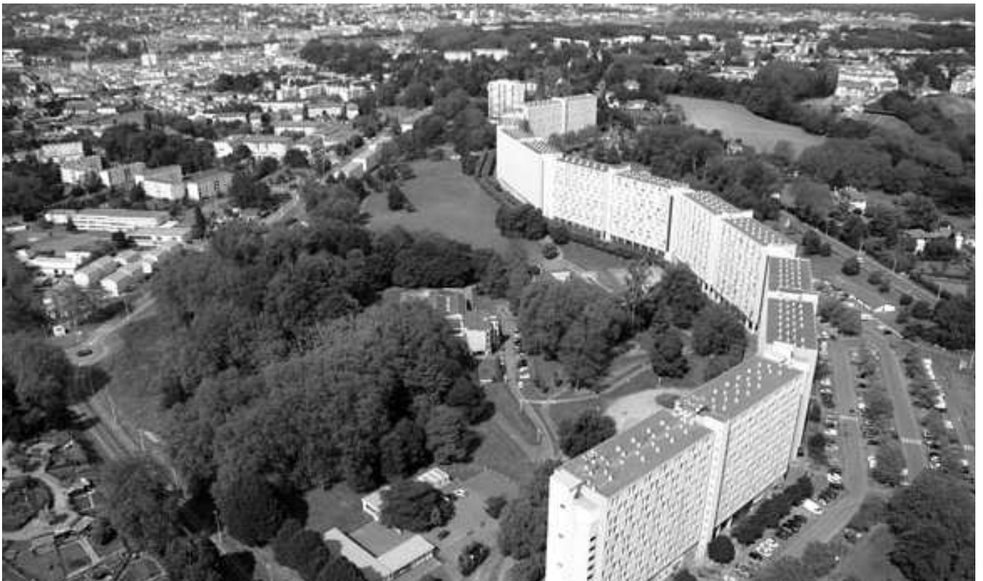
Le quartier des Hauts de Sainte Croix à Bayonne...

Une expérience émancipatrice pour des jeunes des Hauts de Sainte Croix, qui montre qu'il reste possible de s'aménager une place acceptable dans une société qui met à mal