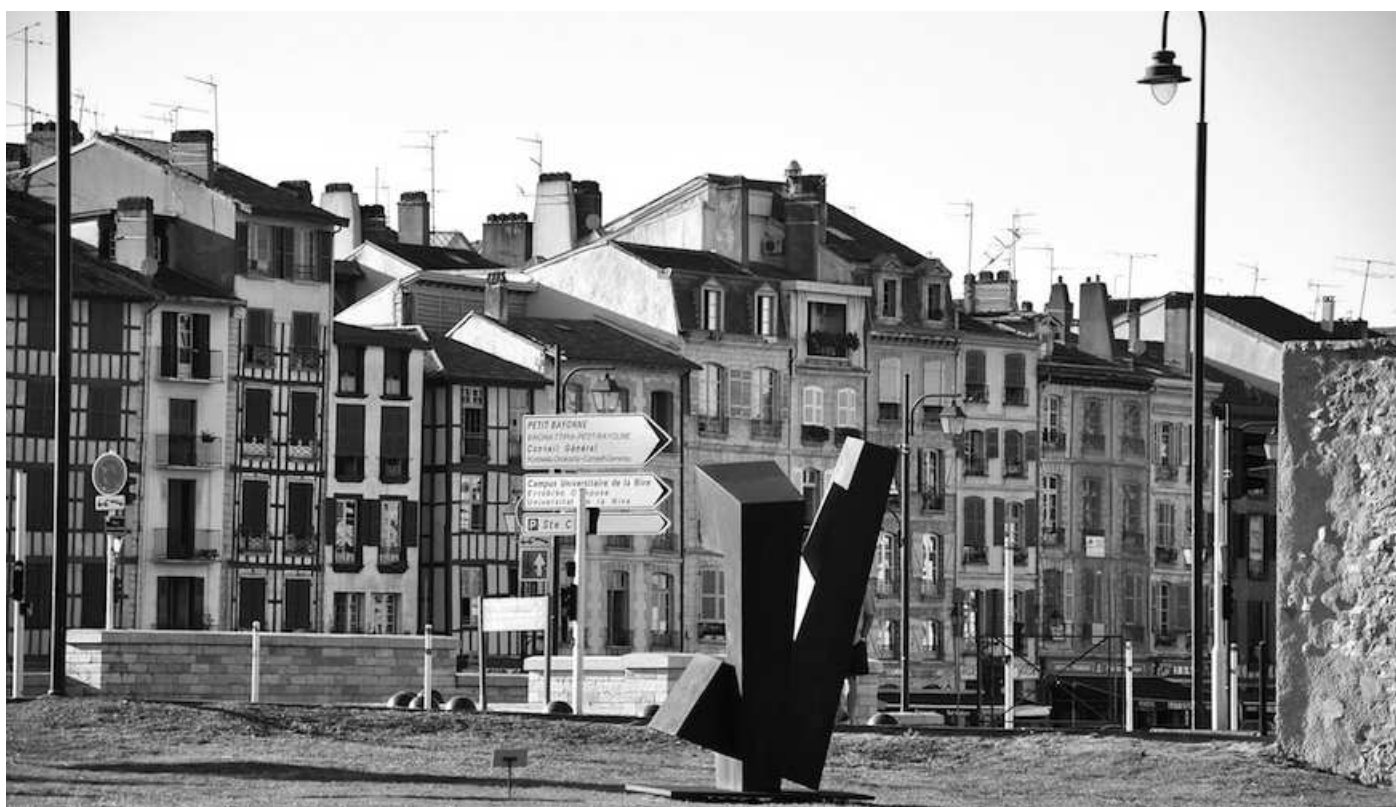
L'espace repos de la Poudrière entre le Conseil Général et le Pont du Génie...