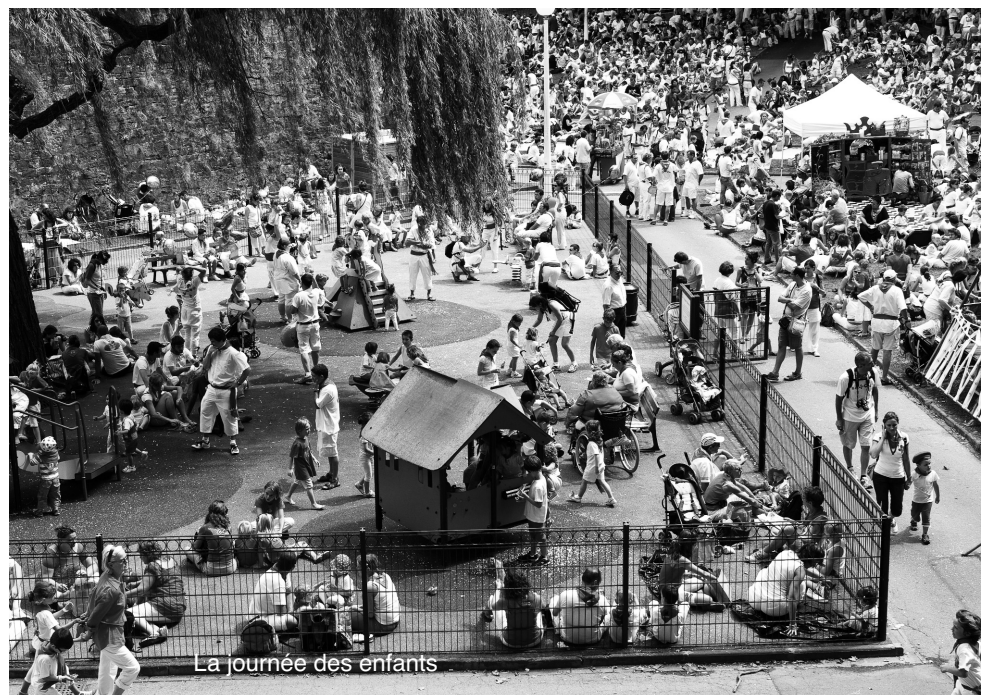
La journée des enfants

Autre nouveauté: la gestion des déchets, les petits festayres trieront leurs déchets et pourront les déposer dans différents containers. Ils pourront aussi, avec l'aide des techniciens sur place, vider directement leurs containers dans un petit camion «école» mis à disposition par les services de la CABAB.