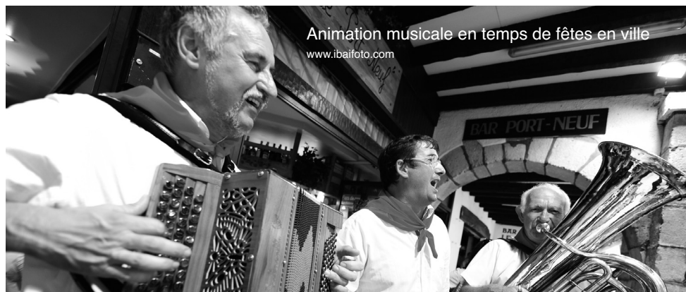
Animation musicale en temps de fêtes en ville

Euskal kultur erakundeak eta Baionako hiriak antolatu Kantu-Cantera gaualdi zikloaren barnean, Errepublika plazan