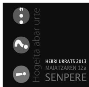
30. Herri Urrats