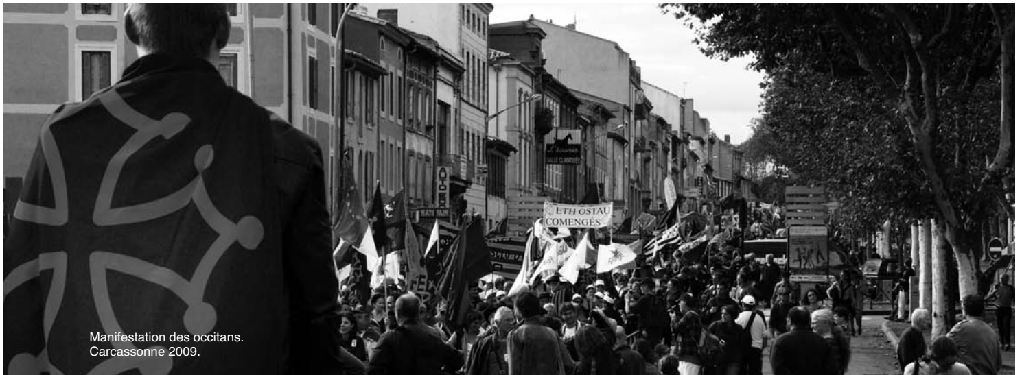
Manifestation des occitans. Carcassonne 2009.