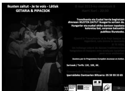
Harri Xurrin Maiatzaren 13an