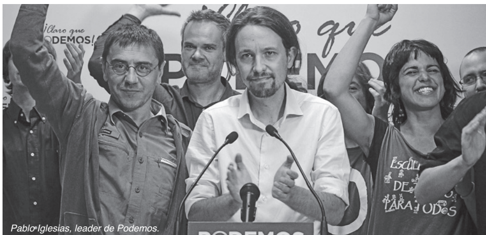
Pablo Iglesias, leader de Podemos.

Pourquoi tous ces scandales ressortent-ils aujourd'hui? En partie, grâce à Podemos qui se bat contre la corruption et a permis de régénérer la vie démocratique. Bien que le PP ait instauré très récemment des commissions d'enquête préalables au choix des candidats aux élections législatives prochaines de mai 2015 (candidats soumis à cinq questions concernant leur patrimoine, revenus...), il y a fort à parier que le mécontentement des Espagnols, des Catalans et des Basques se traduira dans les urnes. Malgré tout, Podemos contraint à un renouvellement de la vie publique. Nous suivrons son évolution avec intérêt. L'Espagne, parviendra-t-elle à changer ses règles? Mettra-t-elle en place des organes de contrôle de la vie publique? L'attitude du nouveau parlement par rapport au droit à l'autodétermination des Catalans, des Basques ou des Galiciens changera-t-elle? Le matraque opéré pendant des décennies par les media espagnols, caricaturant la réalité du Pays Basque laisse des traces (Basque est associé systématiquement à terroriste) y compris chez les militants de Podemos. Quelles relations entretiendra Podemos avec les partis abertzale basques et catalans? Autant de questions que l'on peut se poser à l'heure où l'Espagne risque de vivre un bouleversement, en pleine crise économique (chômage et émigration des jeunes) et politique (perte de confiance dans le monde politique traditionnel).