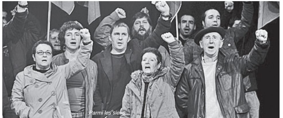
Parmi les siens...

La seule chose qu'il faille prioriser et qui a vraiment de l'importance est celle-ci : décider quelle est la voie la plus efficace pour atteindre l'objectif final.