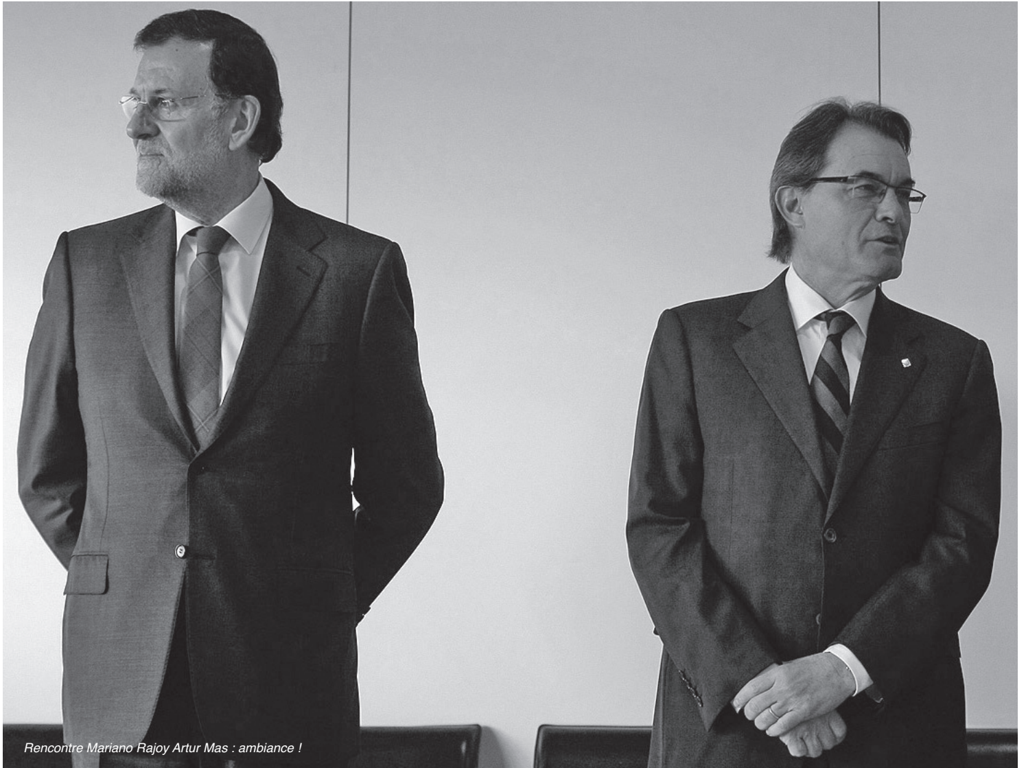
Rencontre Mariano Rajoy Artur Mas : ambiance !