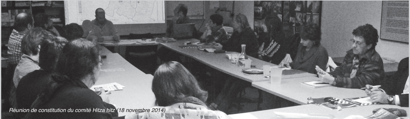
Réunion de constitution du comité Hitza hitz (18 novembre 2014)

à 20h30 au local de la Fondation Manu Robles-Arangiz. Les 21 actions phares y seront précisées et le fonctionnement des relais locaux aussi. Bienvenue à tous ceux et toutes celles qui veulent mettre en marche la transition en Iparralde.