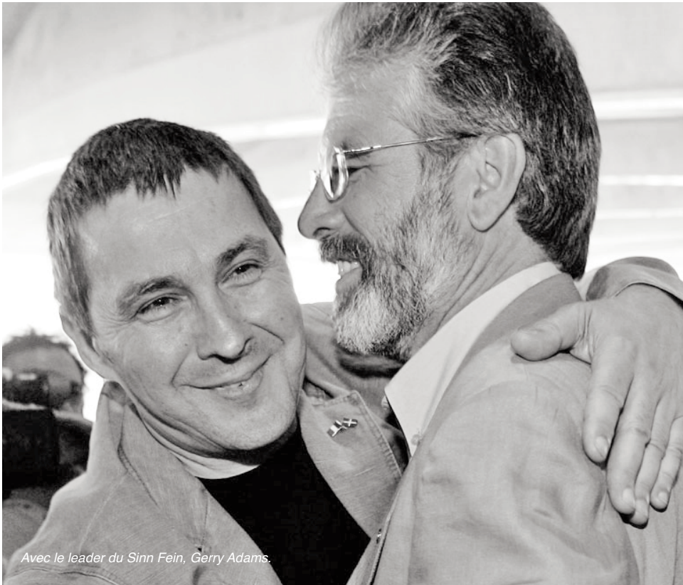
Avec le leader du Sinn Fein, Gerry Adams.

plus important : le plus important c'est ce que pense la société, c'est à elle que revient de juger notre travail. Nous qui voulons changer la société, pour savoir si nous faisons du bon ou du mauvais travail institutionnel, nous n'avons qu'à répondre à une simple question : les gens ont-ils vu un changement au niveau des institutions que nous gérons, dans la politique du logement, par exemple ? Le social ? La culture ? Le processus de participation citoyenne ? C'est là que nous jouons notre crédibilité en tant qu'alternative d'évolution. C'est là, la clé.