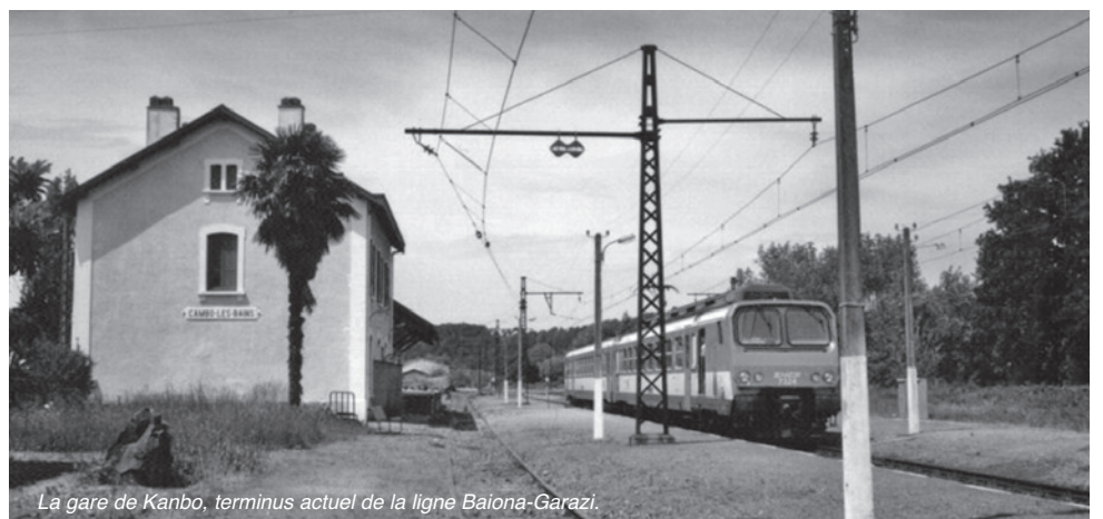
La gare de Kanbo, terminus actuel de la ligne Baiona-Garazi.