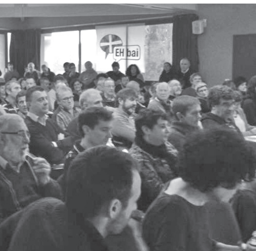
le 20 décembre 2014 à Uztaritze.

Alors que faire ? La question n'est pas nouvelle et la réponse reste à inventer en ce début du XXI e siècle au regard des riches expériences du passé. Pour cela être exigeants, autocritiques, attentifs à d'autres expériences, à l'écoute des classes et du peuple pour lequel on veut se battre. Chemin semé d'embûches mais perspective passionnante. Bon vent à EH Bai !