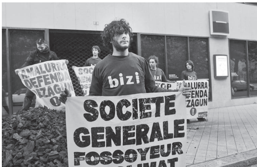
"Bizi ! déverse 1,8 tonnes de charbon devant la direction régionale de la Société Générale à Bayonne le 2 juin 2014".

Les Amis de la Terre viennent de publier le guide éco-citoyen Climat : comment choisir ma banque ? et dressent un classement des banques françaises selon les impacts de leurs activités. Le diagnostic est sévère pour ces banques : leurs soutiens à l'énergie fossile la plus émettrice de CO2 ont triplé entre 2005 et 2013, contredisant leurs engagements à lutter contre le changement climatique et l'impératif de réduction des investissements dans les énergies fossiles. En 2014 Bizi! en lien avec Les Amis de la Terre et Attac, a mené une mobilisation non-violente, déterminée et victorieuse pour le retrait de la Société Générale du projet climaticide Alpha Coal. On peut donc changer la banque. D'autre part, il existe au Pays Basque, de nombreuses alternatives et initiatives dans la finance responsable (Herrikoa, Clefe, Cleje, I-Ener, Lurzaindia). On peut aussi changer de banque.