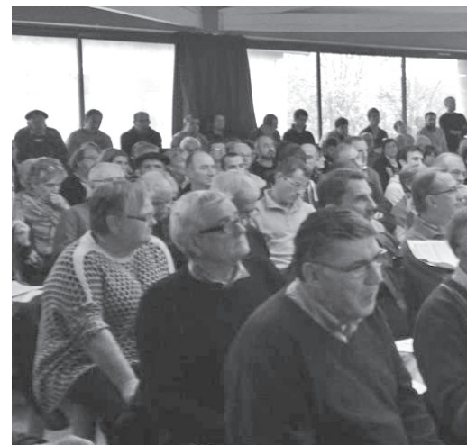
Assemblée générale constitutive d'EH Bai