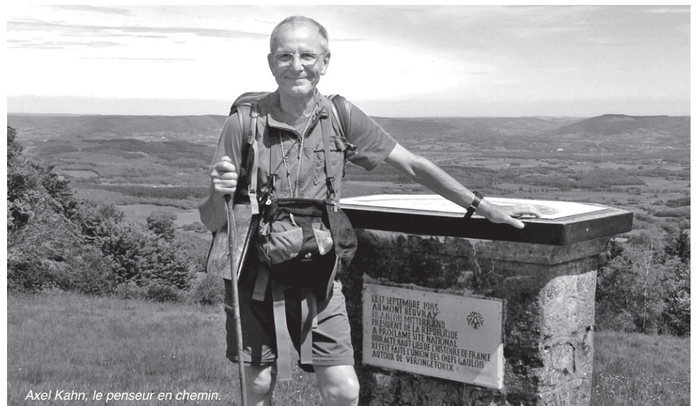
Axel Kahn, le penseur en chemin.