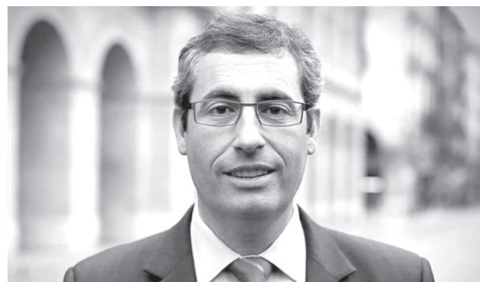
Markel Olano (PNV) en Gipuzkoa.