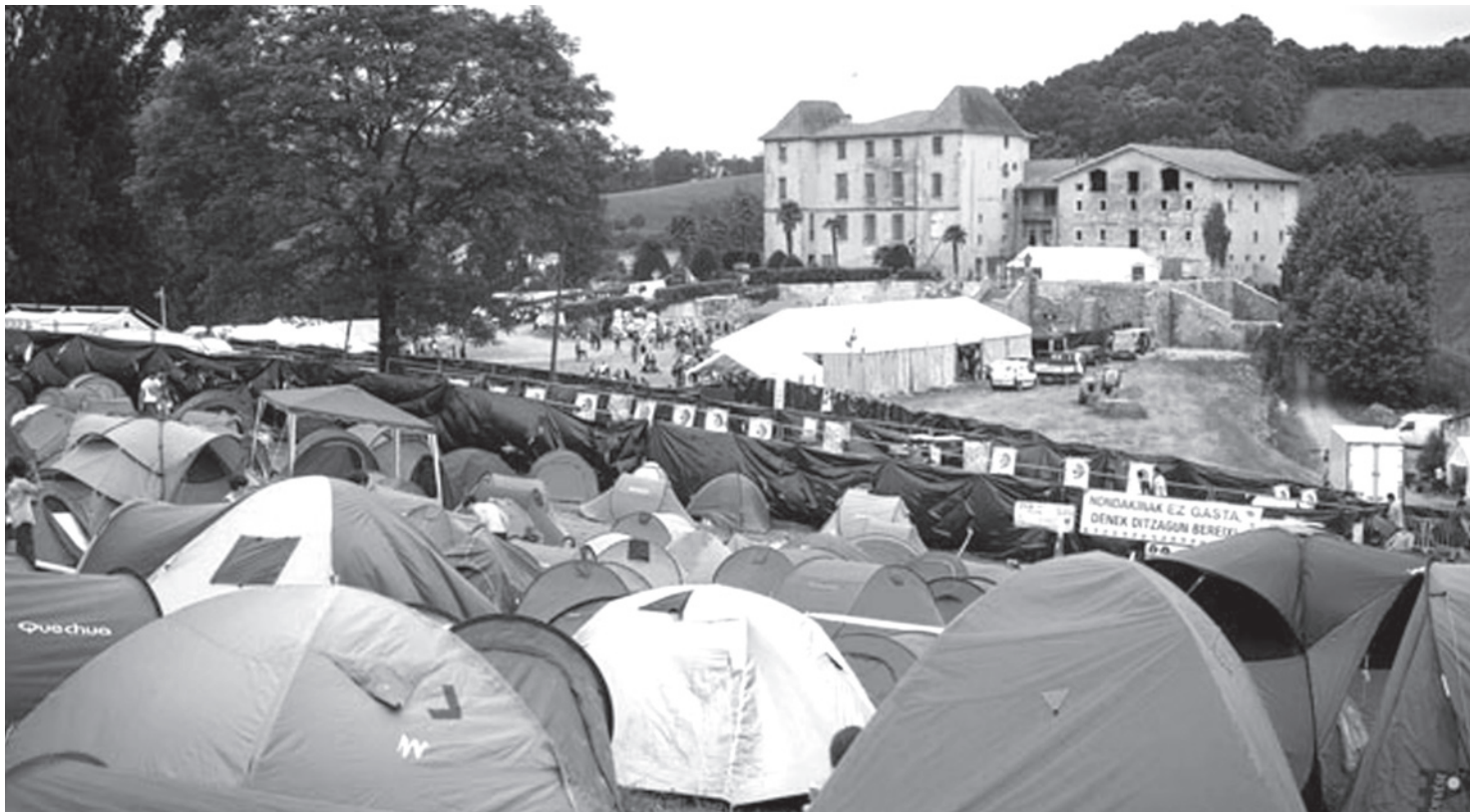
Aurten 20. edizioa ospatuko da Lekornen . EHZri buruzko informazio guztiak : http://ehz-festibala.eu