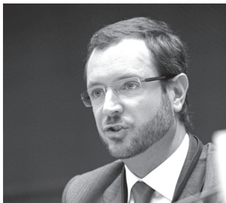
Javier Maroto (PP) à Gasteiz.