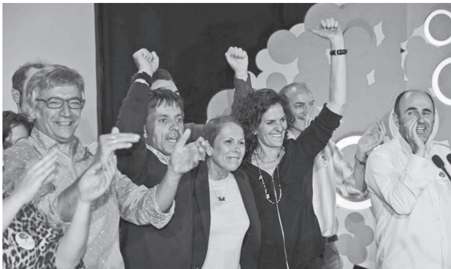
Les candidats de Geroa Bai, heureux de leurs bons résultats le soir du 24 mai.

Plusieurs raisons expliquent la chute d'EH Bildu dont une part de l'électorat s'est orientée vers le PNV et vers Podemos-Ahal dugu. Il lui a été difficile de gérer la capitale et une énorme collectivité locale telle que la Députation que l'on compare chez nous aux Conseils