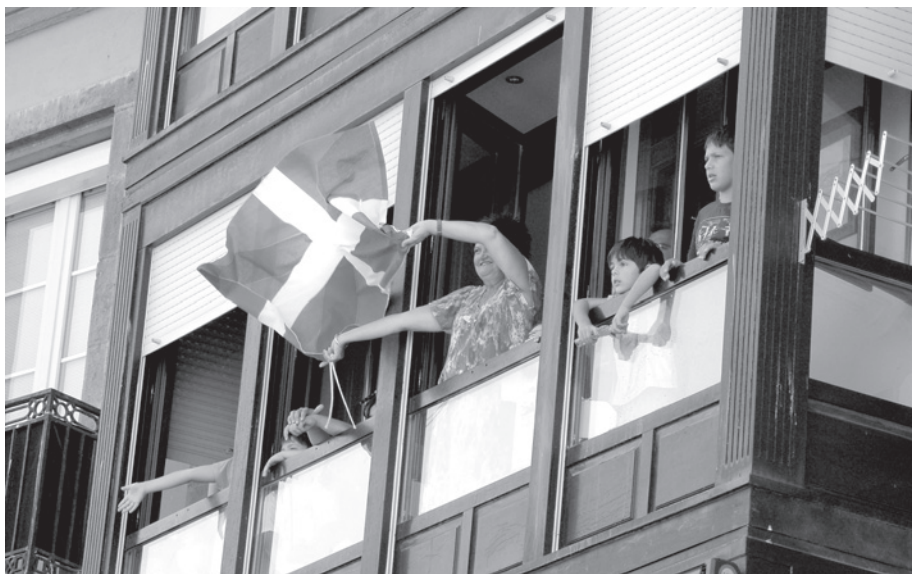
L'ikuriña aura-t-il désormais droit de cité en Navarre ?

Nafarroak hauteskunde horietan nahi izan du erakutsi 21. mendeko jendarte heldu bat izaiteko gai zela demokratikoki eta sozialki.