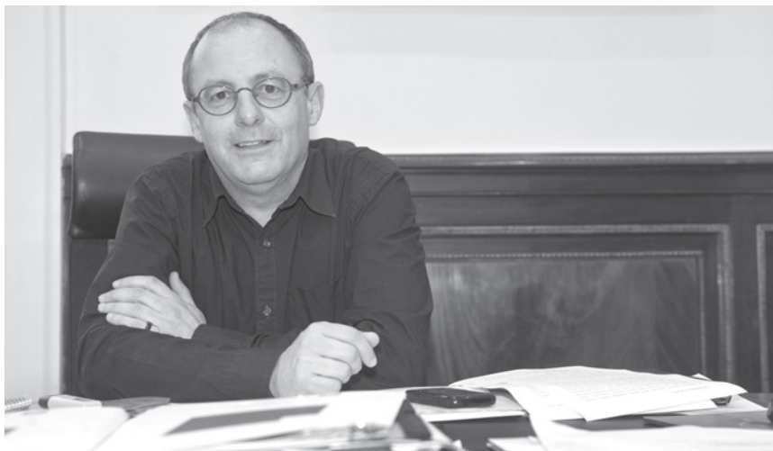
Juan-Karlos Izagirre cèdera son siège de maire de Donostia.

Il faut alors arriver à distinguer ce qui relève du plan politique global, de ce qui concerne la remise en cause du mode de gestion des institutions par EH Bildu. Pour ma part, je crois qu'il faut pointer trois éléments de réflexion. Premièrement, en ce qui concerne la gestion des institutions, EH Bildu n'a pas été perçue comme une force alternative crédible à l'écoute de la population. Secundo, au niveau du contexte politique global, le blocage du processus de résolution du conflit a installé dans la bases sociales d'EH Bildu un climat morose, mais je pense que la problématique est beaucoup plus large. Dans le cadre d'une grave crise économique, le projet souverainiste basque de gauche doit arriver à convaincre de larges couches de la population (bien au delà du spectre abertzale) qu'il constitue une véritable alternative sociale, et ce, par le biais de dynamiques sociales et pas