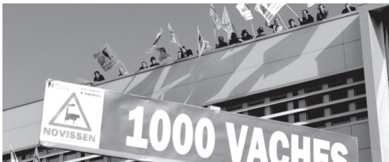
La confédération paysanne se mobilise contre la ferme-usine de 1000 vaches dans la Somme.

Quoiqu'il en soit, il y a des schémas de pensée qui ont des effets dévastateurs sur les systèmes de production, en particulier cette idée qu'il y aurait, d'un côté, un projet agricole, certes sympathique, mais qui ne prendrait en compte que l'écologie et le social, et qui ne serait pas forcément viable ou économiquement compétitif et, de l'autre côté, une agriculture qui serait forcément compétitive parce qu'elle produit des volumes et fait tourner la machine économique en lui achetant et vendant beaucoup. Forcément, la compétitive c'est celle qui, soutenue par l'agroalimentaire et les banques, valorisée par l'image de la modernité et de l'innovation, avance et gagne du terrain. Forcément, celle qui n'est pas compétitive, c'est celle qui résiste mais qui perd inéluctablement du terrain. La compétitivité est la ligne d'horizon qui fait marcher tout le monde au pas ! Il va sans dire qu'elle serait essentiellement économique, le social et l'environnement n'étant que la certi-