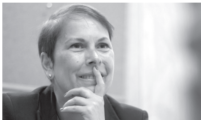
Uxue Barkos (Geroa Bai) en Nafarroa.

efficace. Ceux-ci sont pris en tenailles entre les fantômes du passé d'ETA, la "loi scélérate" espagnole et les preso, véritables otages placés loin de leur pays (2) . L'immobilisme, le ressentiment et la crispation sont mauvaises conseillères. La nécessité de tourner la page d'un type de combat et de travailler à une grande mutation socio-politique, sont à l'ordre du jour. L'autocritique avancée par un de ses leaders Hasier Arraiz en est le signe. Vaste défi : s'inspirer des démarches catalane et écossaise, construire le souverainisme des vingt prochaines années avec d'autres méthodes et de nouveaux leviers, tenir compte de la pluralité de son propre camp et de la société toute entière... EH Bildu peut y parvenir, mais cet aggiornamento peut aussi gérer des tensions internes et affaiblir la coalition.