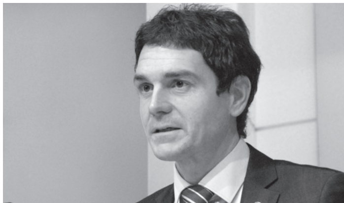
Unai Rementeria (PNV) en Bizkaia.