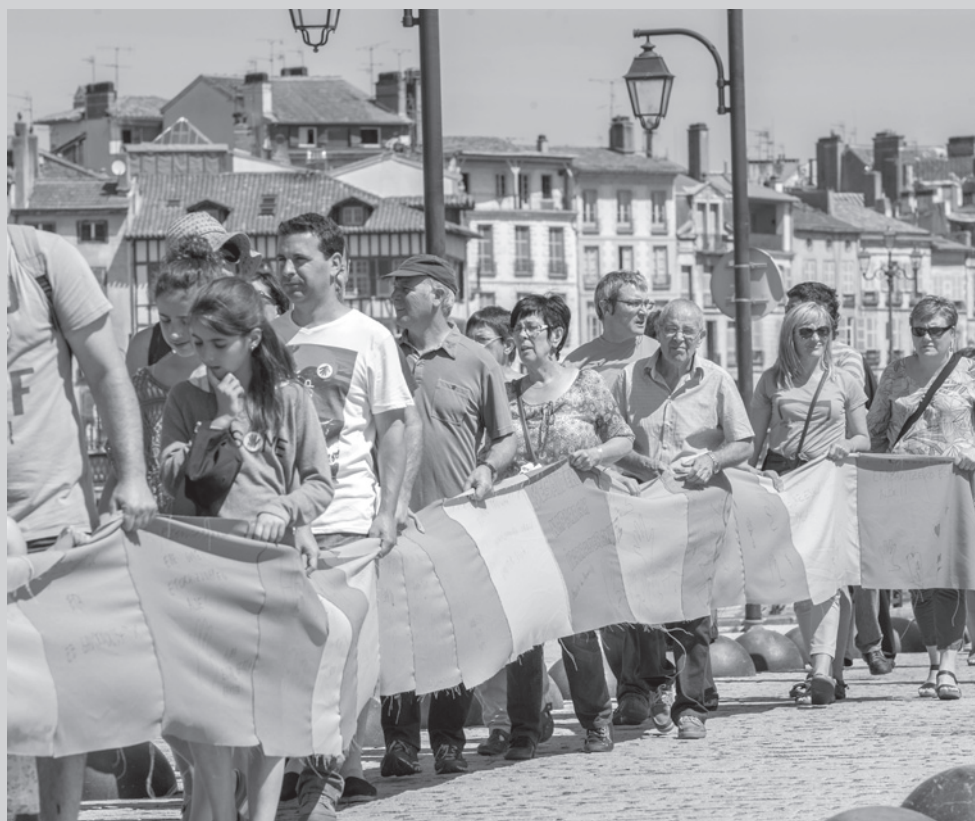
Le 21 juin dans les rues de Bayonne.