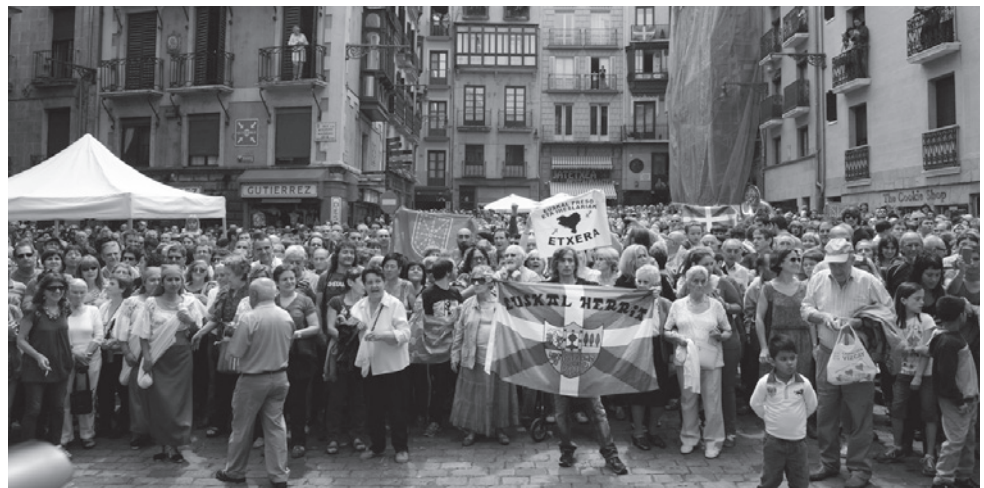
Iruña célèbre la victoire abertzale.

La gauche abertzale ne préside plus aucune députation ni aucune des trois capitales de province. Mais elle arrive en seconde position dans 76 municipalités de la Communauté autonome. Elle conserve son bastion d'Onarroa et parvient à récupérer quelques cités, grâce à des accords avec des listes indépendantes, en particulier Plentzia et Elorrio. En