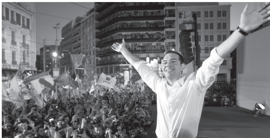
Alexis Tsipras, premier ministre grec.

koan erantzun du. Ondorioz, zilegitasun demokratiko honetan oinarrituz, Islandiako Estatuak zorra osoki ordaintzea ukatu du, Islandian inbertituak diren finantza inbertsioei handik ihes egitea debekatuz, eta zorraren hainbat atal (adibidez kreditu pribatu batzuk) osoki ezabatuz. Neurri horien eragina oso baikorra izan da, Islandiako ekonomiak berriz gora egin baitu, langabezia apalduz. Eta hain zuzen ere, Islandiak zorra osoki ordaintzeari uko egitea erabakitzen zuen momentu hartan, Atenaseko gobernu eta Europar instituzioen arteko negoziaketak tenkatzen hasi ziren. Ordu hartako gobernu-buru sozial-demokratikoa - G. Papandréou - Greziari inposatu murrizketa neurrien ondorio latzak irudikatzen hasi zen.