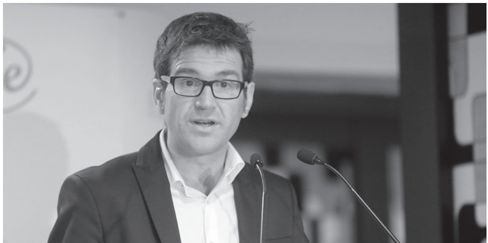
Gorka Urtaran, maire PNV de Gasteiz.