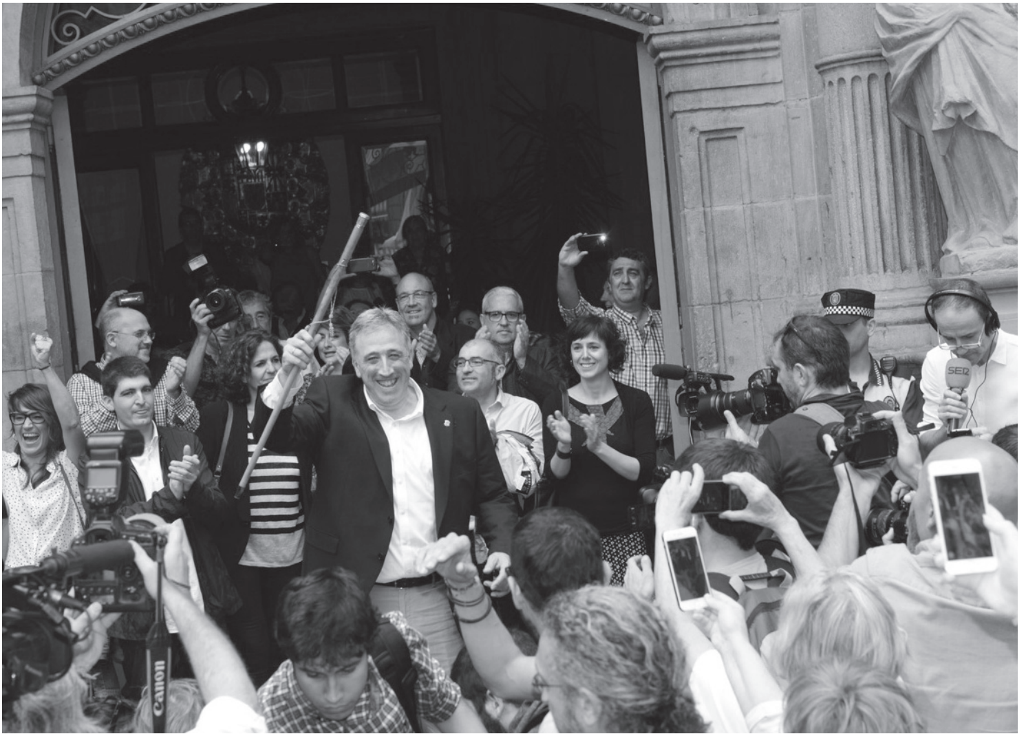
Joseba Asiron lors de son investiture à la mairie d'Iruña.

Gipuzkoa, EH Bildu est le parti qui dirige le plus de villes (36), mais seulement deux de plus de 15.000 habitants. En Navarre, la gauche abertzale arrive en force. Elle dirigeait 21 cités en 2011, aujourd'hui, elle dirigera la capitale Pampelune et plus de 35 municipalités — dont 25 avec la majorité absolue — en particulier Baranain, Lizarra, Tafalla ou Berriozar. EH Bildu passe de 113 conseillers municipaux en 2011, à 297 en 2015.