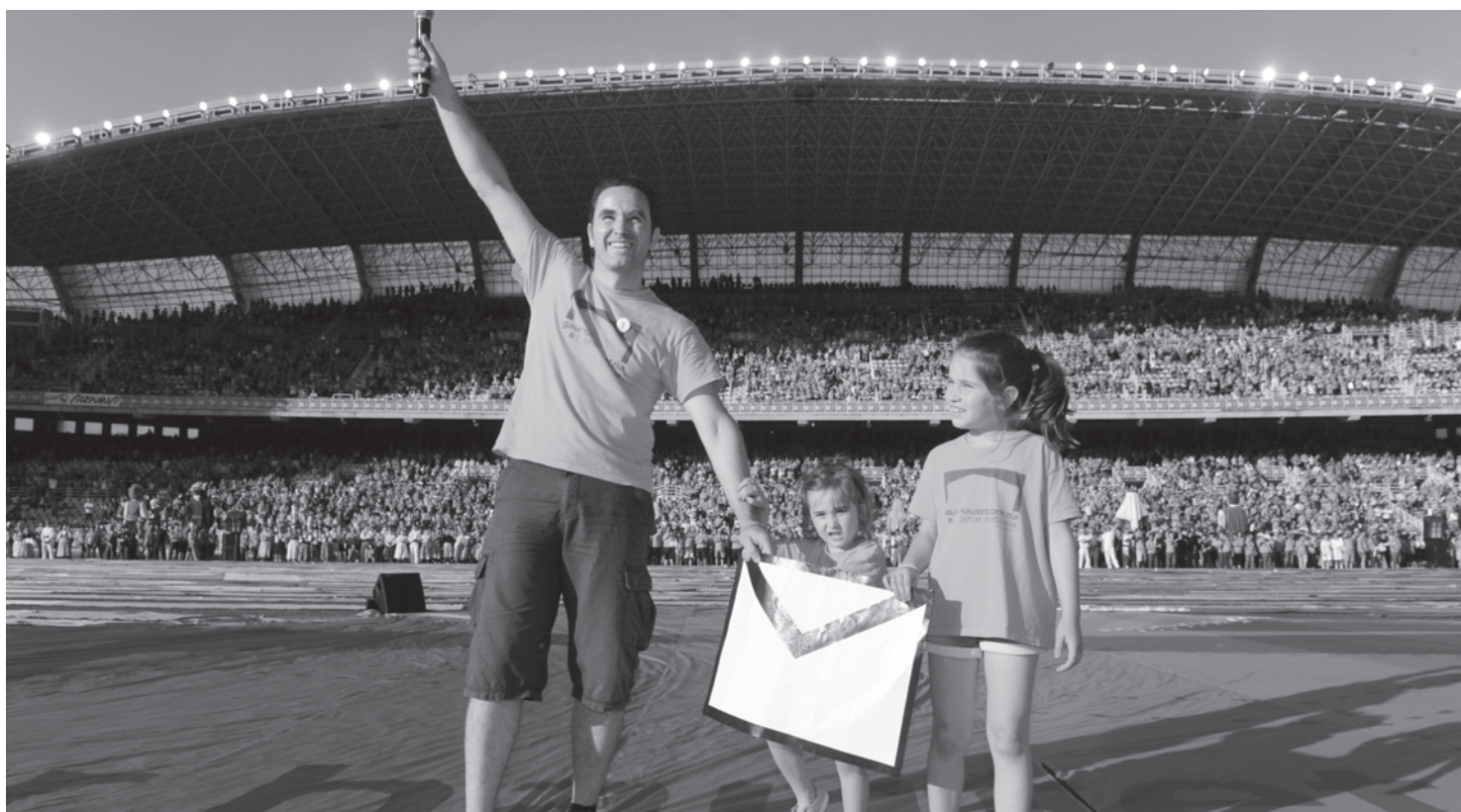
Au stade Anoeta à Donostia , Gure esku dago a rassemblé plusieurs milliers de personnes.

La dynamique Gure esku dago, née en 2013 dans la région de Goierri, se veut citoyenne, démocratique, constructive et participative. "Nous sommes un peuple", "C'est l'heure des citoyens", "Nous avons le droit à décider" sont les trois principes fondamentaux autour desquels Gure esku dago a développé un certain nombre d'initiatives. Mouvement citoyen, Gure esku dago part du fait que malgré la diversité des habitants du Pays Basque, ce qui les unit par dessus tout, c'est la volonté de travailler autour de ce qui les rassemble. Voici les caractéristiques et réflexions de cette démarche en Iparralde.