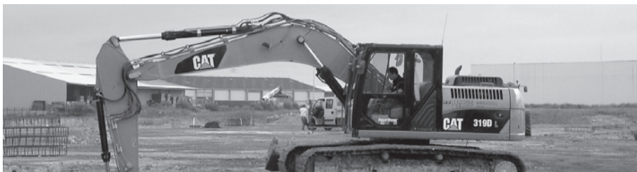
Pelles et débroussailleuses ont décapé les terres bordant l'A63